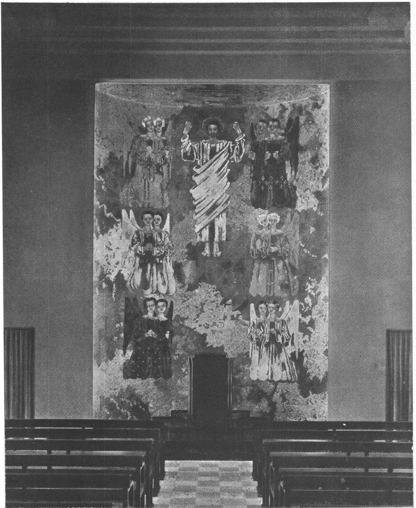
AUGUSTO GIACOMETTI — Mosaico nella Cappella di Manegg in Zurigo.