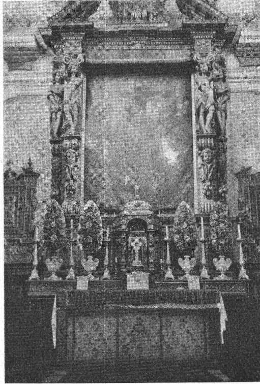
CHIESA DI S.ta DOMENICA - ALTARE MAGGIORE (Fot. A. Bertossa, Coira).