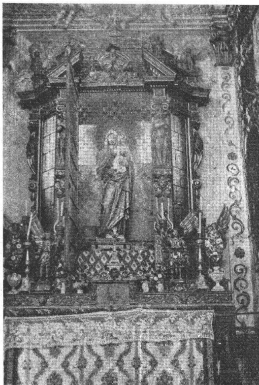
ALTARE DI S.ta DOMENICA.