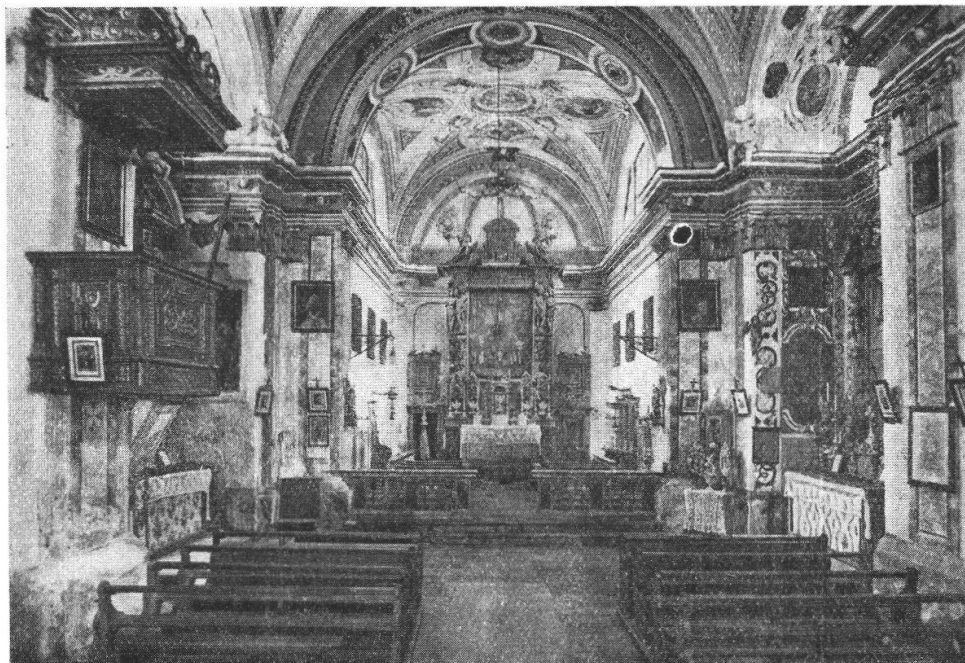
LA CHIESA DI S.ta DOMENICA — INTERNO.

La Chiesa di S.ta Domenica è, dopo quella di S.ta Maria, la più bella delle Case del Signore, nella Valle, ad ogni modo la più bella della Valle interna, e quale nessuno s'aspetterebbe nel villaggetto minuscolo di una terra sì remota.