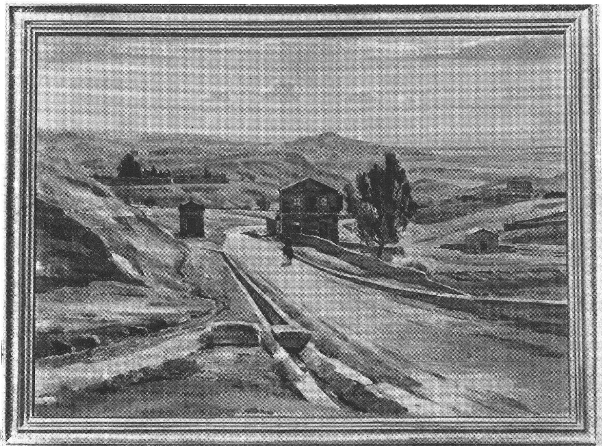
CARLO DE SALIS — Paesaggio siciliano.