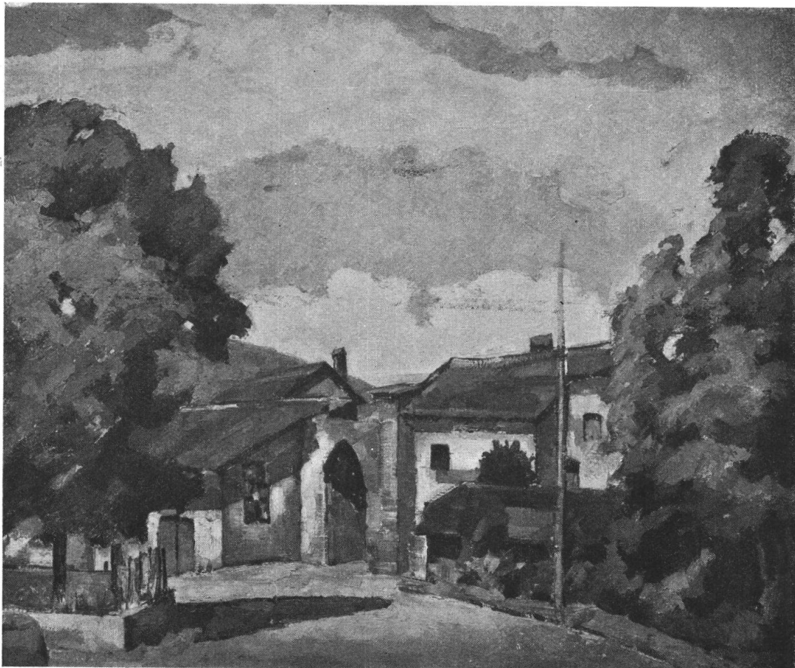
GIACOMO ZANOLARI — Porta orientale.