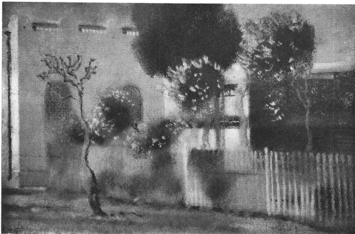
AUGUSTO GIACOMETTI - 1932 - « Sidi-Bou-Saïd » IV.

Metà di Maggio 1934 — metà di Maggio 1935.