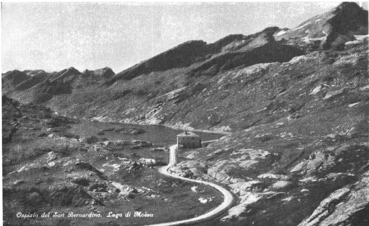
Ospizio del San Bernardino. Lago di Moësa

1. In primis quod prefatus magnificus dominus Comes Henricus de Sacho dominus ut supra ibidem presentialiter dedit et dat plenam licentiam potestatem et baliam suprascriptis monacis ut supra investitis et suis heredibus vendendi ad supscriptam ecclesiam Sancti Bernardini cibum et vinum sine aliquo datio seu pedagio et sine aliqua alia condicione ipsi magnifico domino Comiti Henrico et