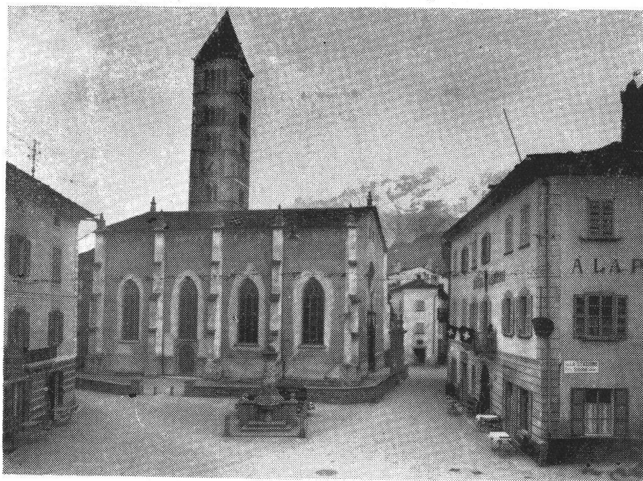
Palazzo Bassus - già Massella -, ora Albergo Albrici — a destra, con le bandierine sul balcone — in Poschiavo.