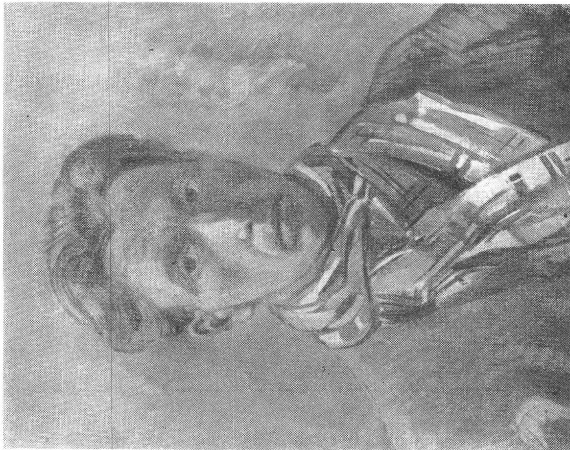
TURO PEDRETTI, Autoritratto (1931). In proprietà privata.