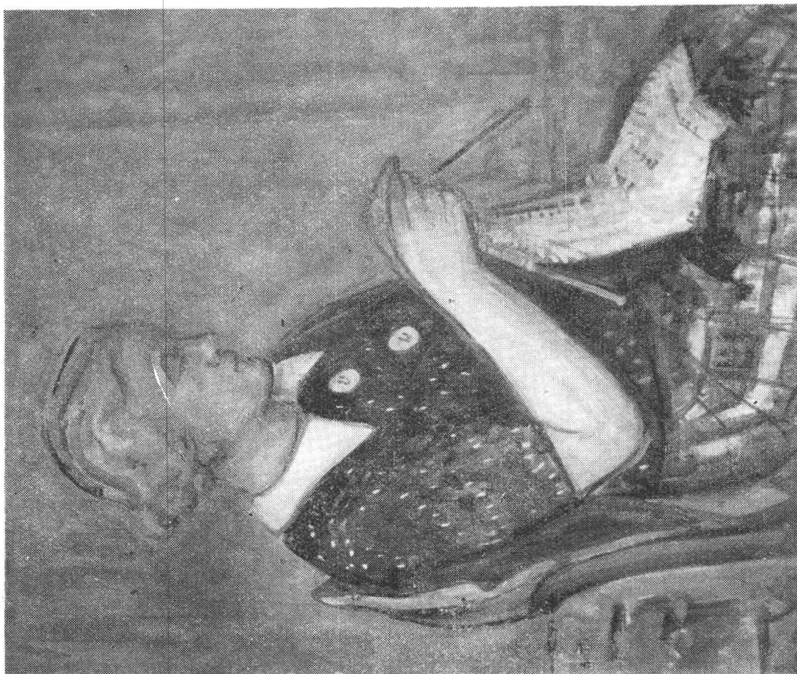
TURO PEDRETTI, « Le tricot bleu » (1936). In proprietà privata. Esposto alla 19.ma Nazionale d'arte a Berna 1936.