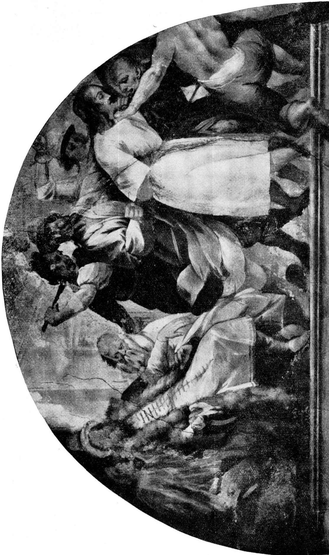
GESÙ DAVANTI A ERODE, attribuito a Giov. Lanfranco. Dalla Cappella del S. Sepolcro in San Carlo.