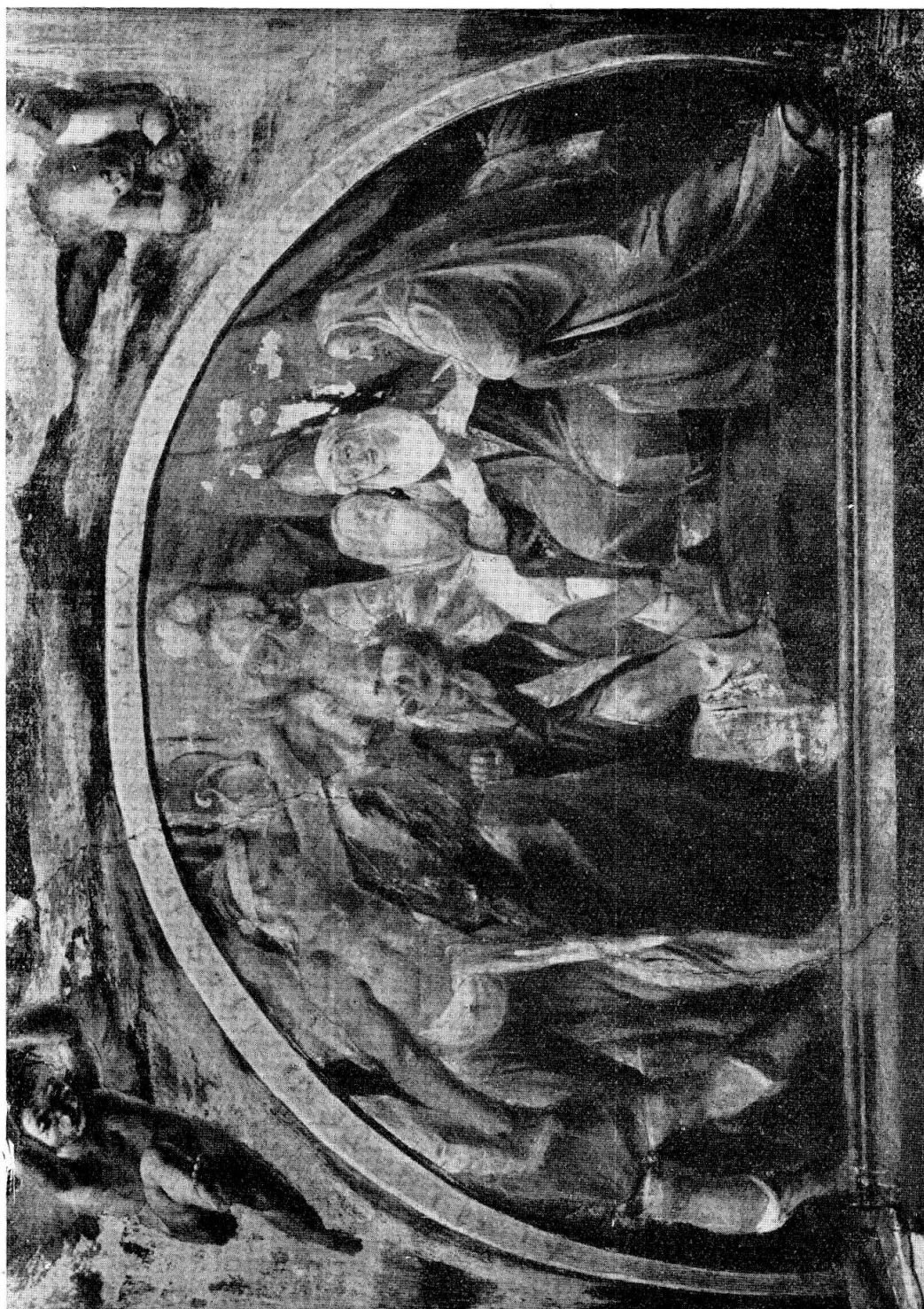
GESÙ DAVANTI A CAIFA

attribuito a Giov. Lanfranco. Dalla Cappella del S. Sepolcro in San Carlo.