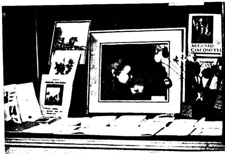
7-28 V a Coira: VETRINA LIBRERIA GMÜR