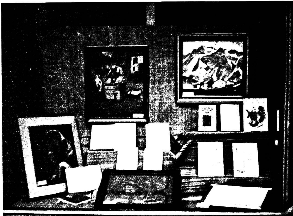
7-28 V a Coira: VETRINA LIBRERIA SCHULER