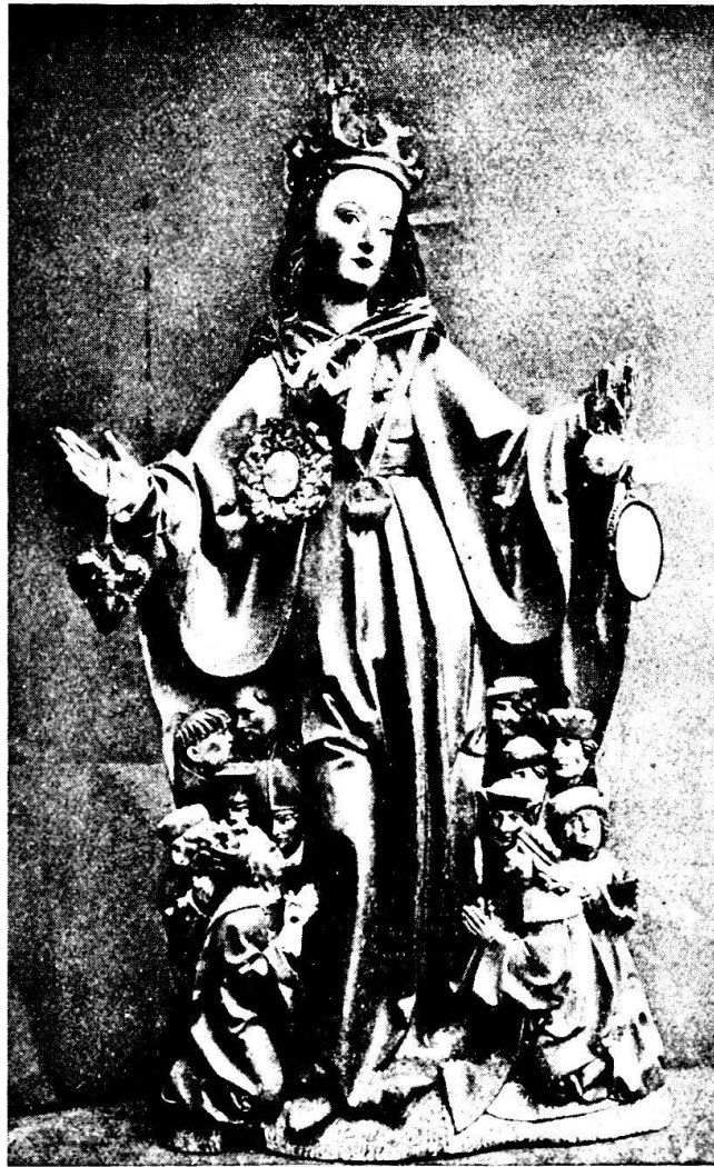
LA MADONNINA DAL MANTELLO, in Carasole di Roveredo