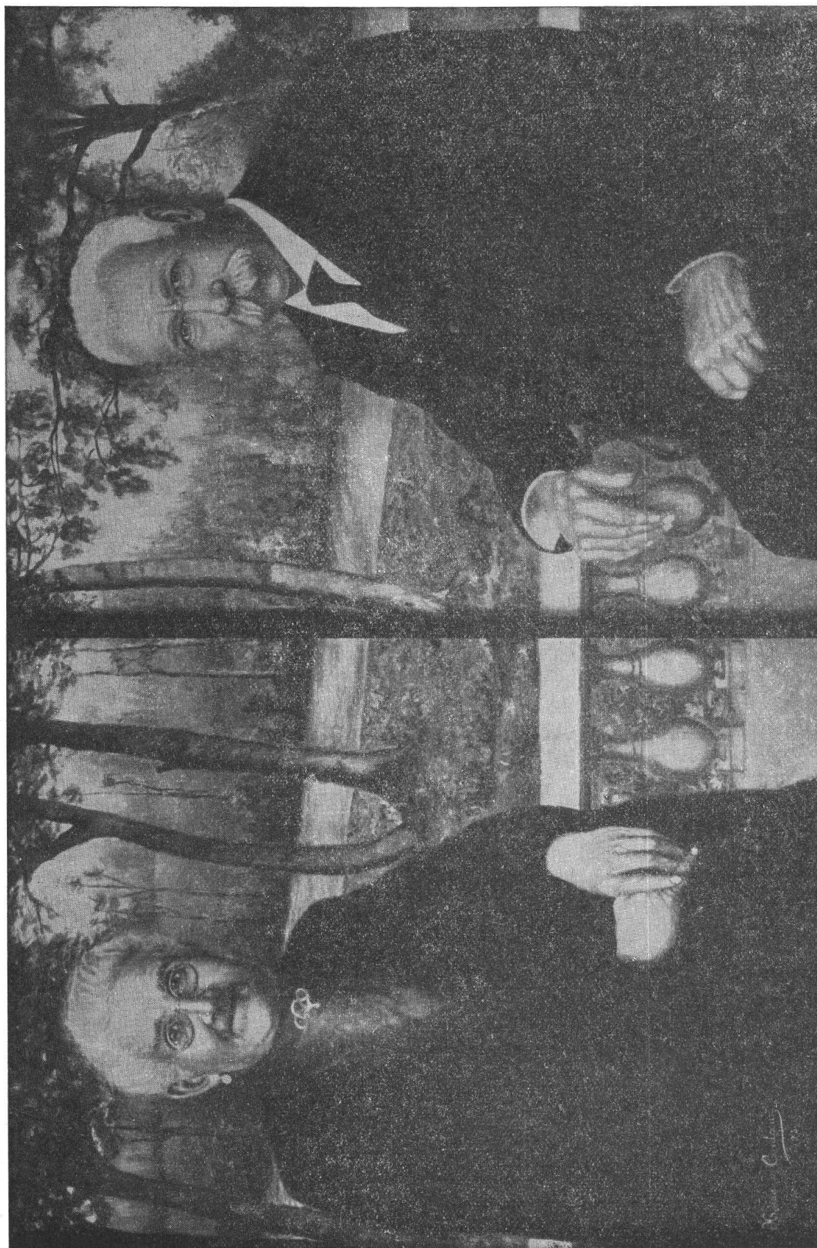
XENIA DE CANTIENI — I miei genitori — Olio.