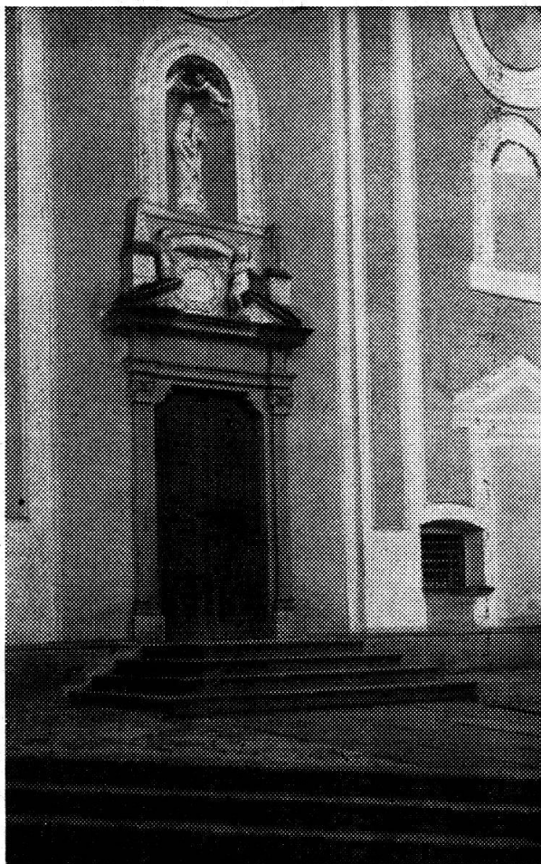
Sant'Anna — Portale