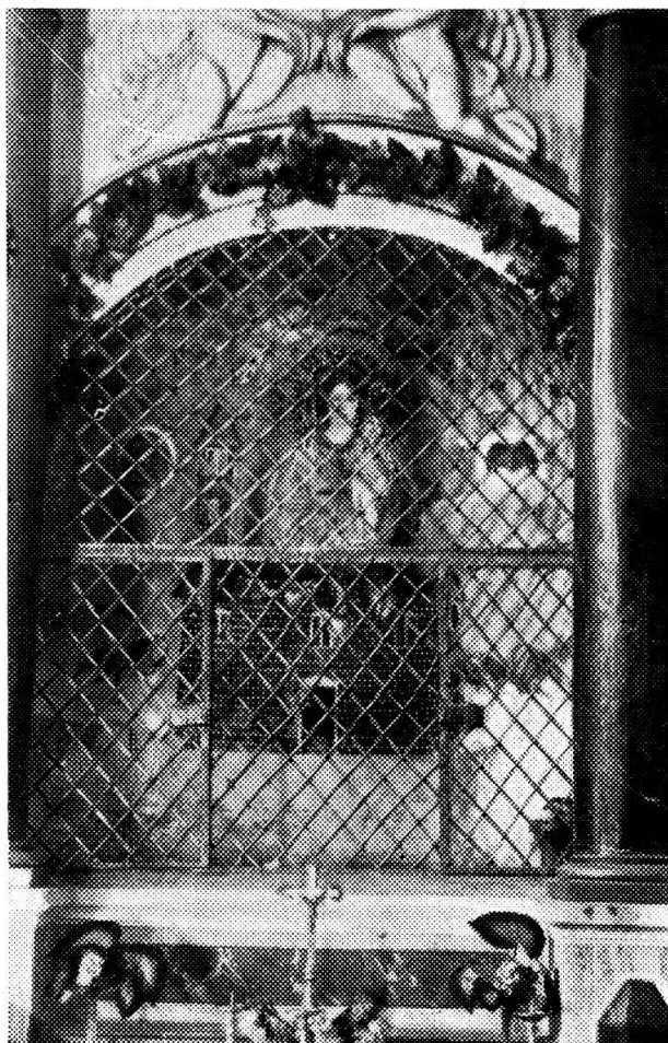
Sant'Anna — Affresco cappella della Madonna

Sei le cappelle, di cui quattro con l'altare sulla parete laterale e due con l'altare nella parete dell'entrata nel coro. A sinistra della porta maggiore: San Tommaso, Santa Lucia e San Giuseppe; a destra: Sant'Antonio da Padova, San Francesco d'Assisi e la Madonna.