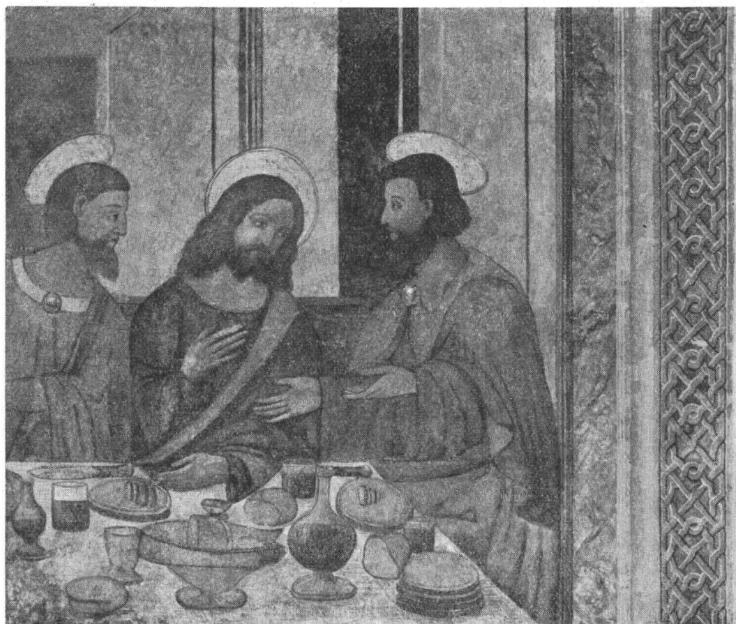
S. Fedele, La Santa Cena. Lato di sinistra

stato e andava rinnovata 1) . Di pretta ispirazione vinciana, si deve a un non trascurabile artista ignoto della prima metà del 16. secolo, che l'avrà condotta a fine prima dei lavori di ricostruzione del tempio conchiusi nell'anno inciso sul portone: 1543. — Di bell'equilibrio nelle dimensioni, in un primo tempo l'opera accoglieva anche lo spazio sotto la sacra tavola, rivestito in seguito di un intonaco alto, in qualche luogo, fino a 2 cm. E' probabile che ciò avvenisse quando, in ossequio alla disposizione vescovile, si «rinnovò il quadro», ad un tempo in cui si era smarrito il senso per il dipinto af-