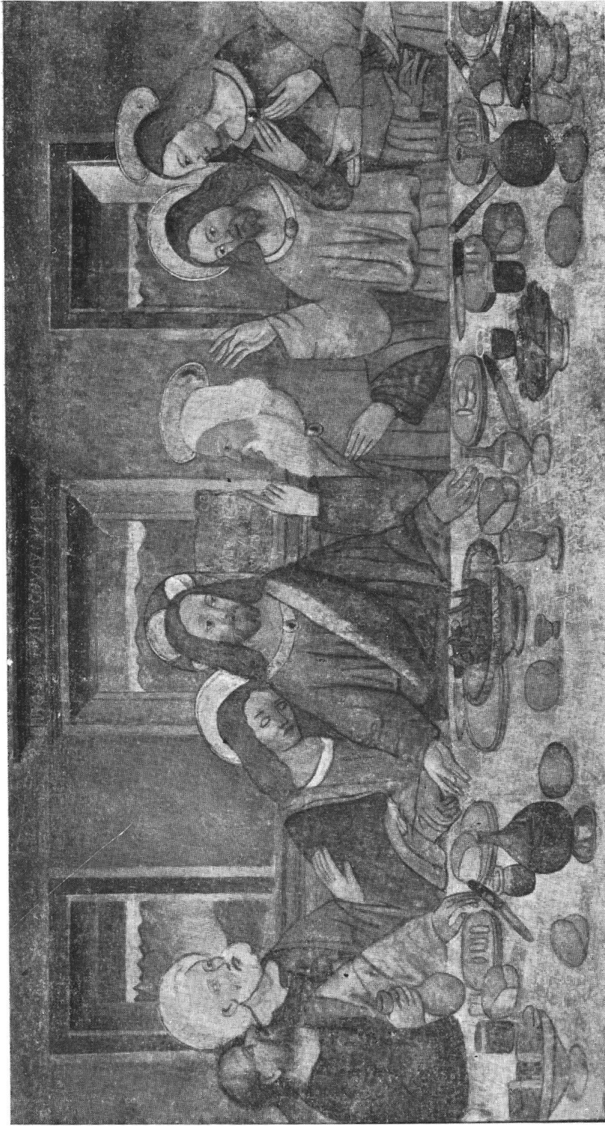
S. FEDELE. — LA SANTA CENA. L'affresco staccato sulla tela. Parte centrale