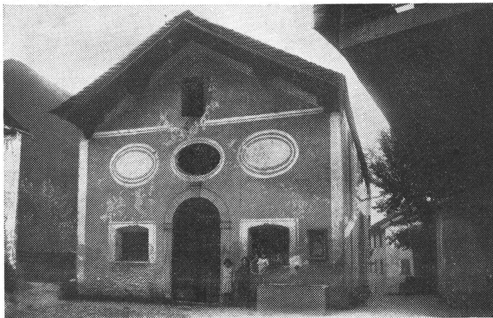
Chiesa S. Fedele — Roveredo

Col tempo le processioni a S. Fedele cessarono e la popolazione disertò la chiesa sicchè nel 1851 (10 VI) il comune decideva: « In vista che la chiesa di