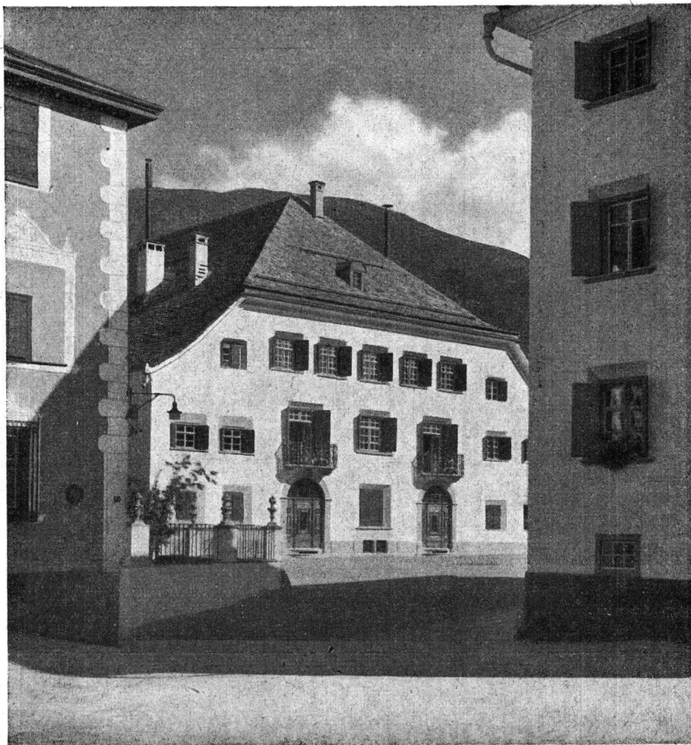
Casa Planta — Facciata sulla strada

Quella chesa nun appartgniva pü a noss temp, ne nu pigliaiva pü üngüna part vi da la vita da nossa vschinaucha. Sepulida in sia egna s-chüirdüna, paraiva elle da zuppanter qualchosa cha üngün nu cugnuschaiva. Que faiva l'impreschiun, cha ün sulet raz da sulagl chi entress lo, stuvess occasiuner üna revulziun e cha üna persuna chi ris-chess da zapper in quels ambiants restess striuneda. Als infaunts da tuot