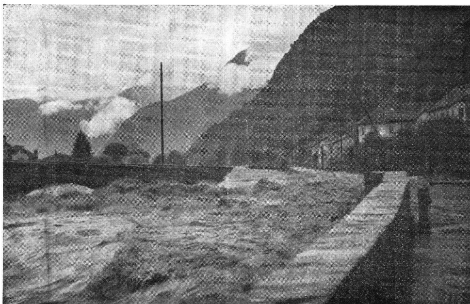
Roveredo. Durante la piena 8 VIII 1951. Il Ponte di Valle ha ceduto.

Nel tardo pomeriggio parve che il cielo volesse schiarirsi e vi fu anche un momento di sosta nella pioggia, la quale durava ormai ininterrotta e violentissima dalla mezzanotte. Ma sull'imbrunire, ripresa della pioggia torrenziale, con grande ansia delle popolazioni che si sentivano ormai esposte alle furie delle acque che ovunque avevano supe-