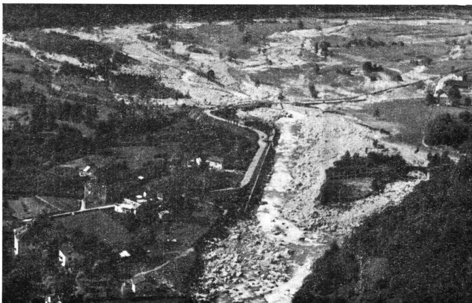
La Calancasca s'è riversata sui prati di Vera. 8 VIII 1951

Verso mezzogiorno, questo torrente, che durante la mattinata aveva impressionato per il mancato gonfiamento, sintomo certo di qualche insidioso ingorgo o serra, parve destarsi e rivelare tutta la sua violenza. Quasi improvvisamente, trascinando macigni, tronchi, alberi intieri con rami e radici, parve lanciarsi dal valloncetto scosceso ed angusto contro il villaggio, attraverso il canale pur protetto da un forte argine. In breve il canale fu ripieno di materiale, specialmente nel corso inferiore, presso lo stradale. Allora l'acqua superò gli argini, travolse cataste di tronchi, rotoli di corda metallica destinati ad una teleferica, distrusse e seppellì