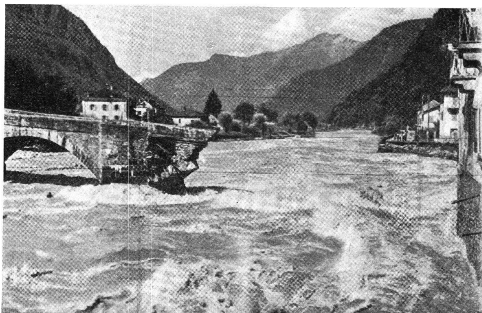
Roveredo. Dopo la piena 8 VIII 1951.

telefonico, era paurosa la notte nella fitta oscurità e senza possibilità di comunicare con il resto della Valle e del mondo. Interrotta la strada a Lumino, a San Vittore, a Roveredo e al Ponte di Ferro, danneggiata e distrutta la linea ferroviaria a Molinazzo, a Lumino e a Roveredo, erano immobilizzati in Valle i forestieri di passaggio, non potevano tornare i valligiani assenti per ragioni di lavoro, i quali poi dalle poche notizie che potevano raccogliere, potevano anche dedurre danni e catastrofi ancora maggiori. Ma il sole incoraggiava a superare il primo momento di sbalordimento e di prostrazione. Sulle strade e sulla linea ferroviaria si metteva mano ai primi lavori di sgombero, gli operai delle imprese di elettricità e quelli dell'amministrazione dei telefoni si prodi-