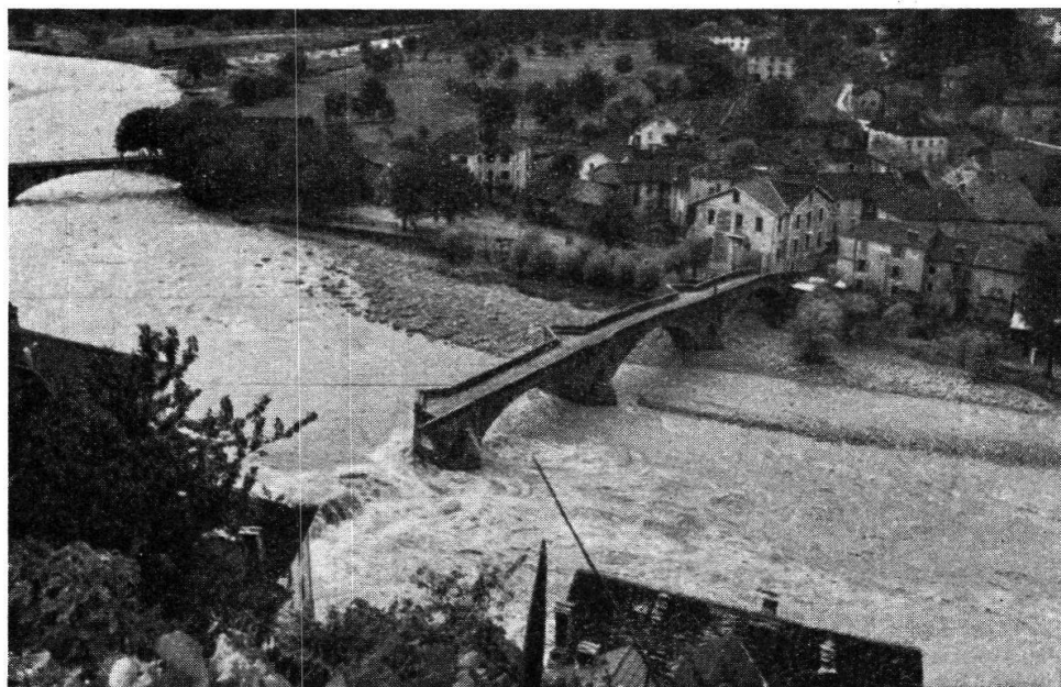
Roveredo. Il Ponte di Valle mutilato dopo la piena 8 VIII 1951

Naturale che una tale massa d'acqua, qual'era quella convogliata dalla Calancasca, non potesse essere senza conseguenze sulla Moesa, già in piena anch'essa. Quasi contemporaneamente al pericolo minacciato dalla Calancasca si profilò per Roveredo quello che effettivamente doveva avere ben maggiori conseguenze reali. Travolti gli argini presso la « Monda Toscano », la Moesa cominciava a straripare in prossimità della piazza di tiro e del ponte ferroviario, allagando Piazza dei Noci e giù giù tutta Piazzetta. Tuttavia, si poteva argomentare facilmente