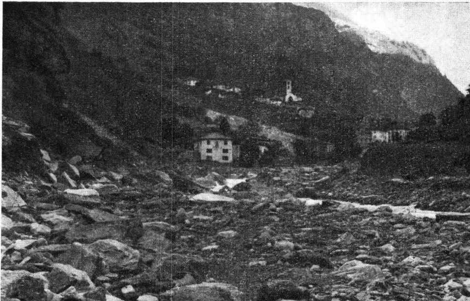
Arvigo. Dopo la piena 8 VIII 1951. La strada è stata inghiottita dalle acque. Il fondo-valle è ormai solo greto della Calancasca.

Straripando da tutte le parti la corrente investiva sulla sua destra la segheria Pacciarelli - Rigassi. Testimoni oculari ci hanno detto che fu un attimo: il fabbricato, abbastanza vasto ed ingombro di grandi