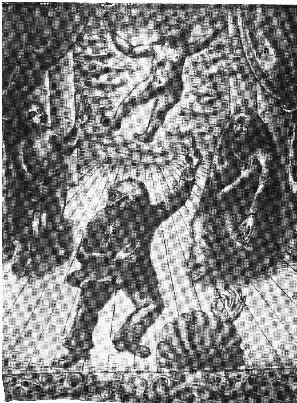
Illustrazione per il „Signore dei poveri morti“, disegno a seppia, 1943

nuovo è dato dal passato, dal presente e dal futuro, — che vive e vuol vivere nella sua arte, nel surreale, al di fuori del tempo. Tuttavia, sebbene questo sia, probabilmente, il suo desiderio, il suo conato artistico, bisogna chiaramente riconoscere che Filippini vive anche realisticamente, ren-