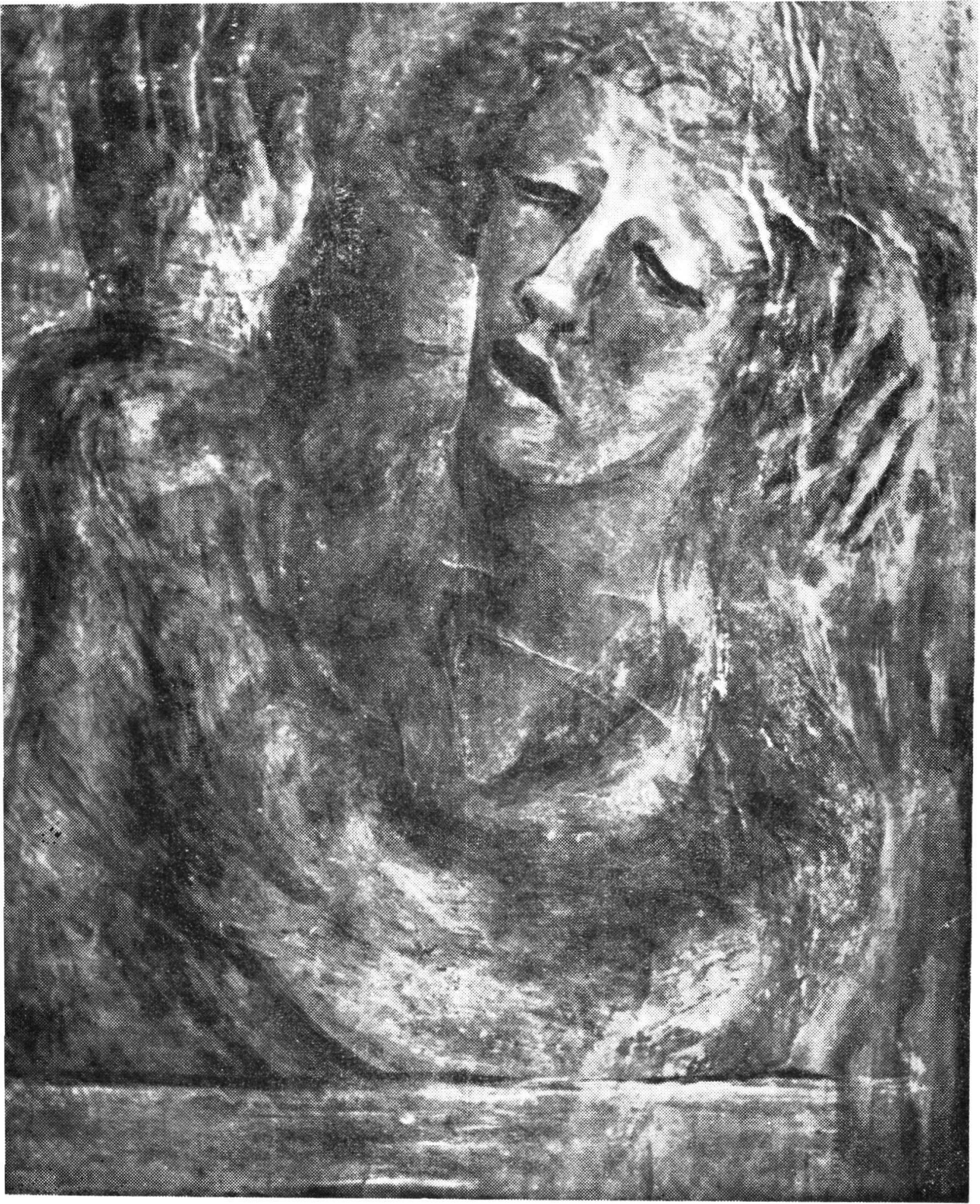
„Soldato morente“, tempera, 1912