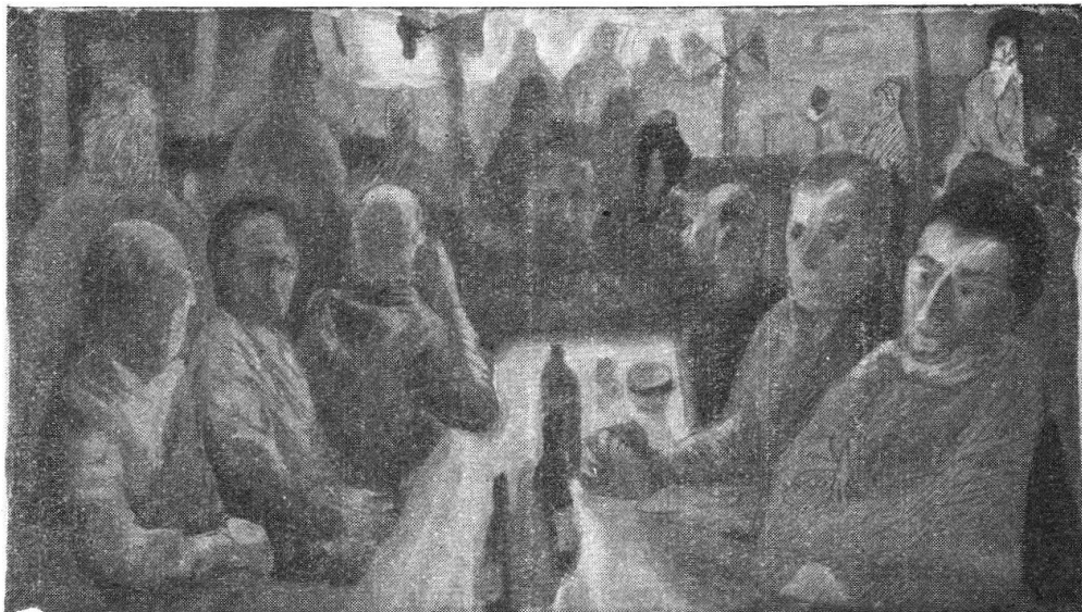
„Cena al grotto“, tempera, 1948