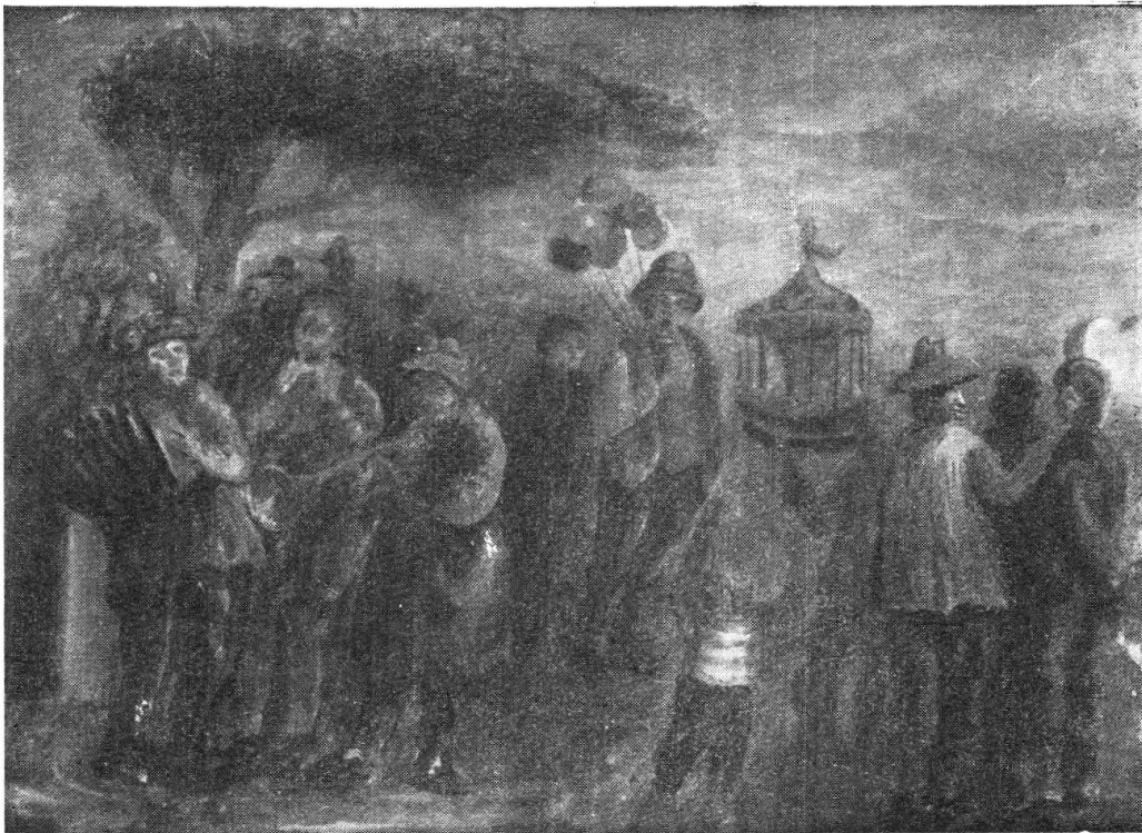
„Festa campestre“, tempera, 1945