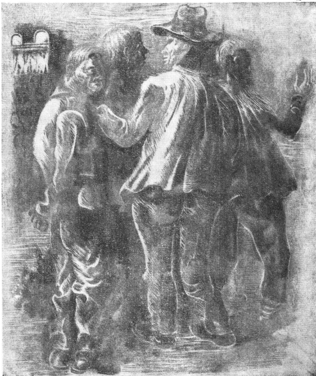
„La festa campestre“, particolare di un'incisione del 1944

Felice Filippini pittore. Essi vanno dal paesaggio alla figura umana, da uno spiccato stile surrealista a un veritiero senso del reale. Così le « TRE GRAZIE », dipinto acquistato dal governo ticinese, stanno a significare che la bellezza vera dell'umano non sfugge nemmeno a Filippini quando la realtà viene immaginata con un senso di bellezza e di grazia e non in funzione di un turbine di passioni o di un'atmosfera triste e