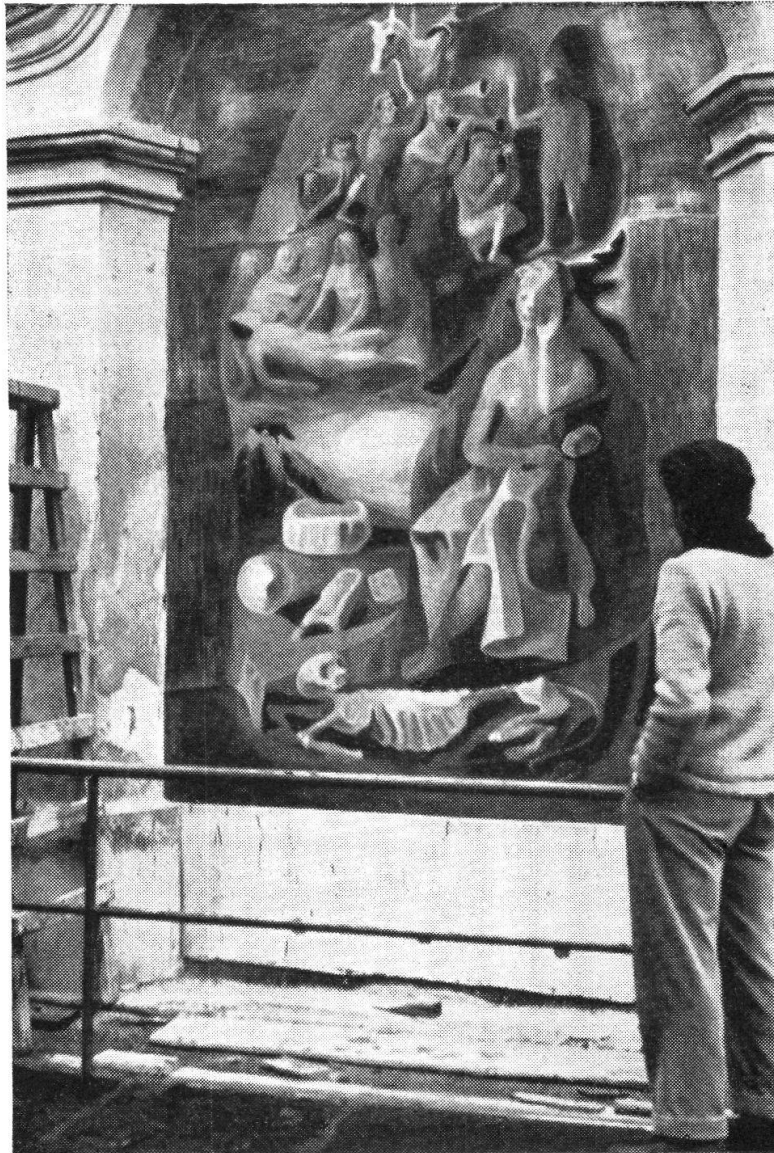
„La Melanconia“, affresco sulla Cappella di Locarno, 1951

Filippini conosce ed è cosciente della differenza tra il suo mondo poetico-artistico e quello di chi lo circonda, ma, pur nell'avidità di assimilare ciò che gli altri fanno e di apprendere al massimo, tutto vuol vedere e penetrare, nelle più recondite espressioni, nei contrasti, nelle bellezze, nelle sfumature, nelle brutture, nelle strutture. Filippini consuma molto ossigeno artistico per la troppa anidride carbonica, che ha in sé. Con questo linguaggio chimico ci pare si possa condensare il mondo estetico di Felice Filippini artista, pittore, scrittore.