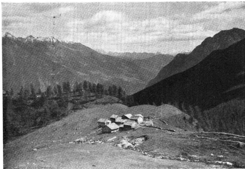
Il paesello alpestre di Ur (1935 m s.m.)

Il «grotto» serve da cucina. I pali appoggiati ai cascinali si adoperano per il trasporto del fieno a valle.