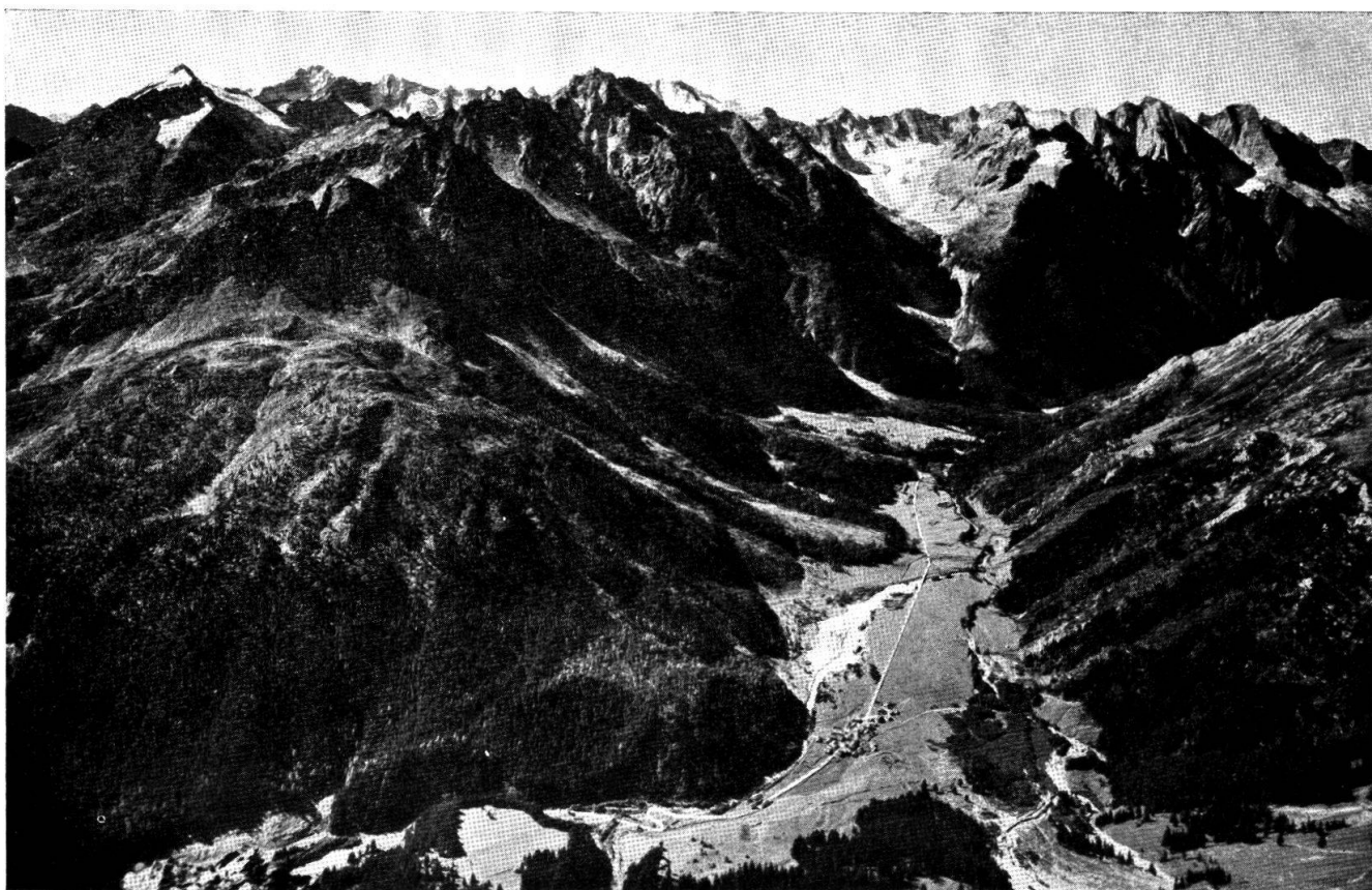
Parte superiore della Val Bregaglia col bacino dell'Albigna sullo sfondo, vista dal Pizzo Lunghin. Sul davanti, in basso, Casaccia.

Esse sono due: quella del comune di Vicosoprano per l'Albigna e quella dei comuni di Vicosoprano, Stampa, Bondo, Soglio e Castasegna per la Maira fino a Castasegna. La concessione per la Maira si riferisce solo al corso a partire dalla quota 1090, sopra il villaggio di Vicosoprano. Casaccia praticamente non partecipa a questi corsi d'acqua. Tuttavia, anche questo comune ha firmato la concessione, siccome la concessionaria