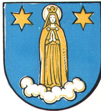
S. Maria i. C.