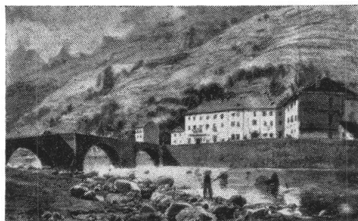
Il Ponte, silografia a colori, 1867

Nel febbraio 1954 l'Ufficio tecnico cantonale fece demolire il Ponte di Valle a Roveredo, mutilato nella sua arcata verso Piazza e scosso nel suo tratto di mezzo dall'alluvione 8 VIII 1951.