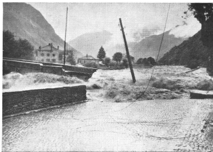
Il Ponte cede all'alluvione. 8-8-1951

Nel 19. secolo alla data 1830 va aggiunta un'altra, posteriore, se il ponte lo si dà per distrutto oltreché dalla piena della Moesa del 1829 anche da quella del 1834, come appare dalla Sentenza pronunciata il 4 IX 1840 dal lodevole Tribunale Supremo del Cantone de' Grigioni nella causa promossa dalla Comune di Roveredo contro la Valle Mesolcina in ordine alla manutenzione del Ponte di Roveredo.