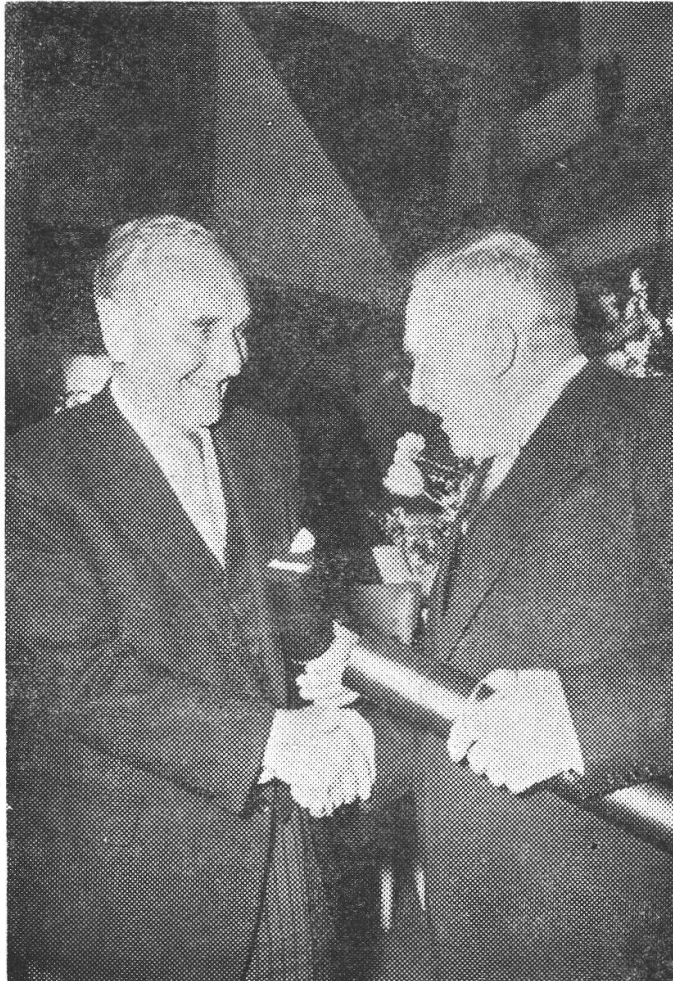
I due nuovi dottori h.c.

Il 29 aprile 1957, nella ricorrenza del Dies academicus l'Università di Zurigo ha conferito la laurea ad honorem al redattore della rivista e presidente della PGI.