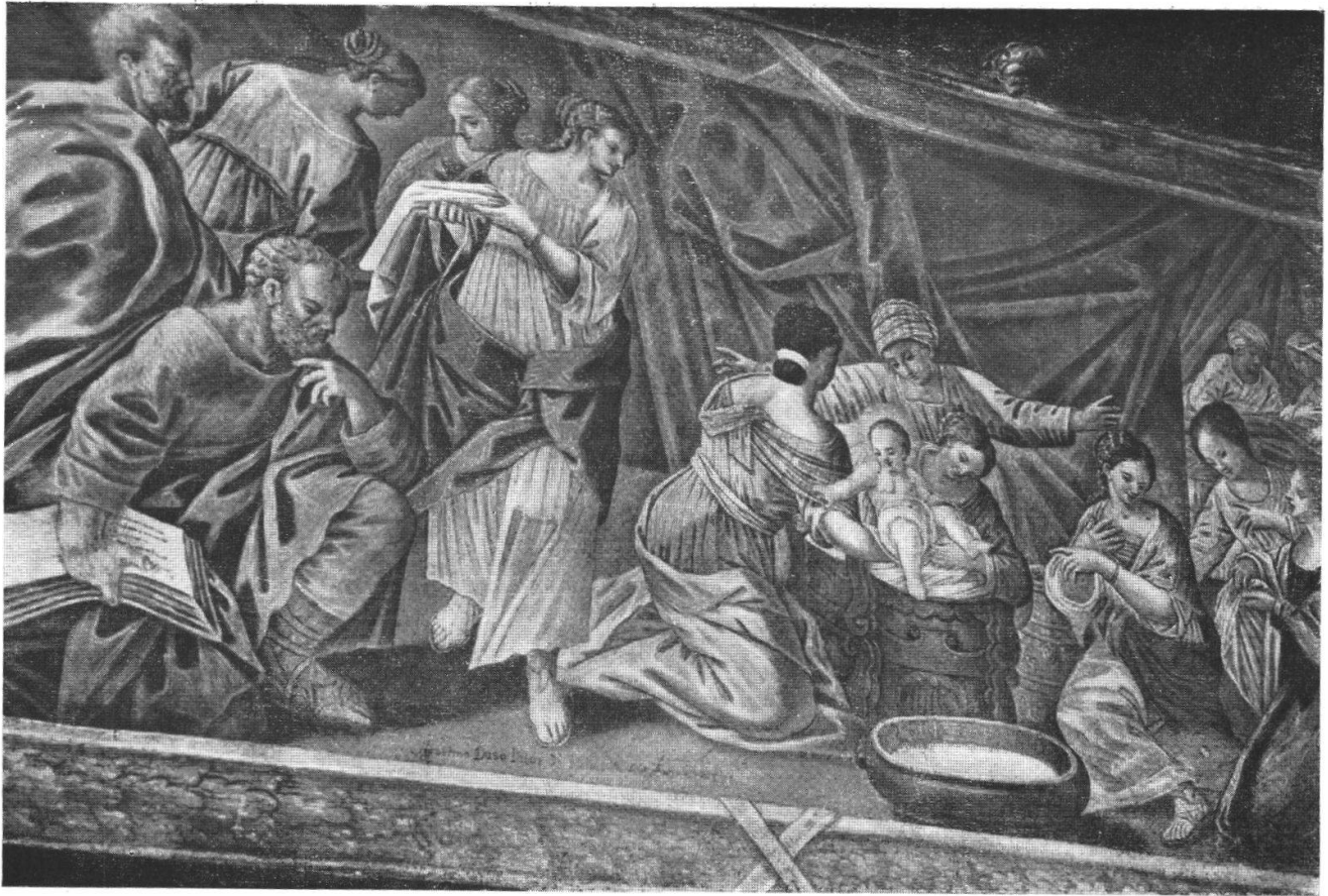
Agostino Duso, La nascita di Maria, S. Maria di Calanca, ca. 1700

Vergine che regge il Bambino Gesù in piedi sul tetto di una capanna; sotto il piano delle nuvole, la terra: la visione di Monaco di Baviera, nei profili dei suoi edifici religiosi; nel lato destro, in medaglione l'autoritratto dell'artista. Mediocre il quadro, ma l'autoritratto dà la piena misura della capacità dell'autore che l'ha accompagnato dell'iscrizione: MartinUs zen Drall PICtor MonaChII AetatIs sVae 56 . Il cronogramma dà l'anno in cui il quadro fu fatto: 1714 M * V * D * I * C * C * I * I * V e con ciò anche l'anno della nascita del pittore 1714 - 56 = 1658 . — La tela è l'offerta ai suoi conterranei, curata durante una vacanza in patria. Visse, pittore di corte, a Monaco dove 1688 si sposò e dove nacquero i suoi figli — significativo è che padrino del primo figlio fu l'architetto Giovanni Antonio Viscardi, padrini e madrine degli altri cinque figli l'architetto Enrico Zuccalli o i suoi familiari: siccome il Viscardi e lo Zuccalli si avversavano spietatamente, parrebbe che lo Zendralli in un primo tempo curasse le migliori relazioni con ambedue gli antagonisti, ma che poi propendesse per lo Zuccalli. — Fu però membro della Confraternita del S. Sacramento nella Parrocchiale roveredana per 50 anni e fino alla sua morte 1735.