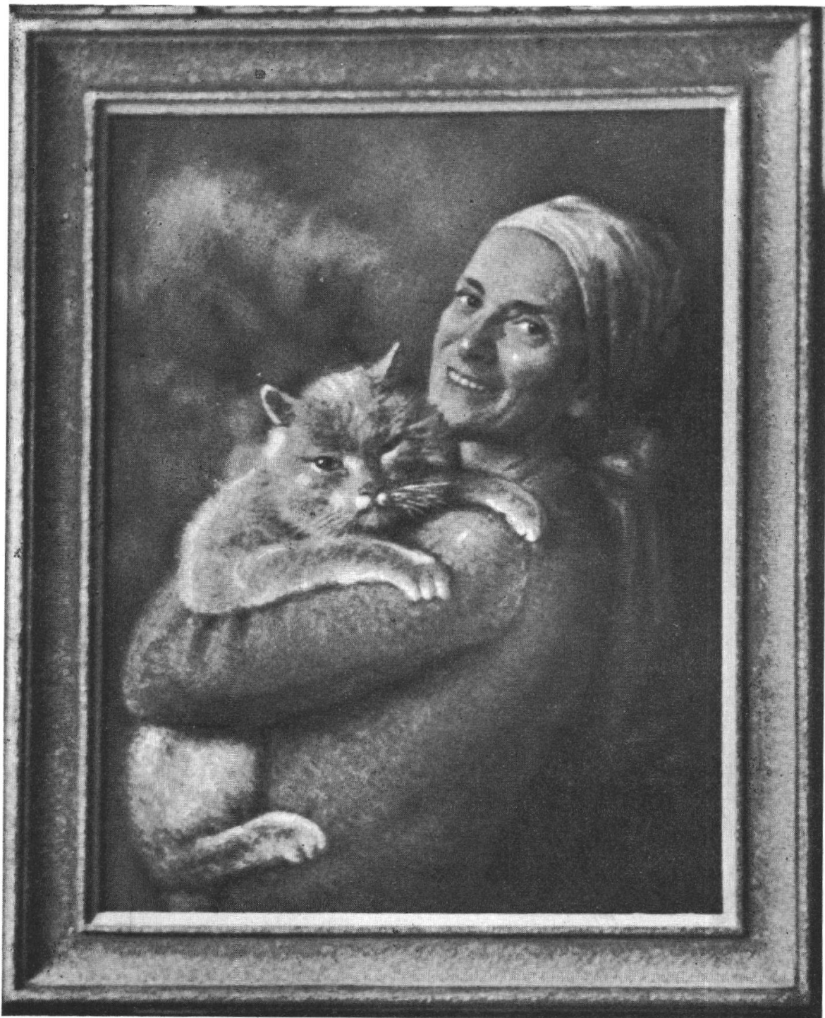
Oscar Nussio — Ritratto di donna