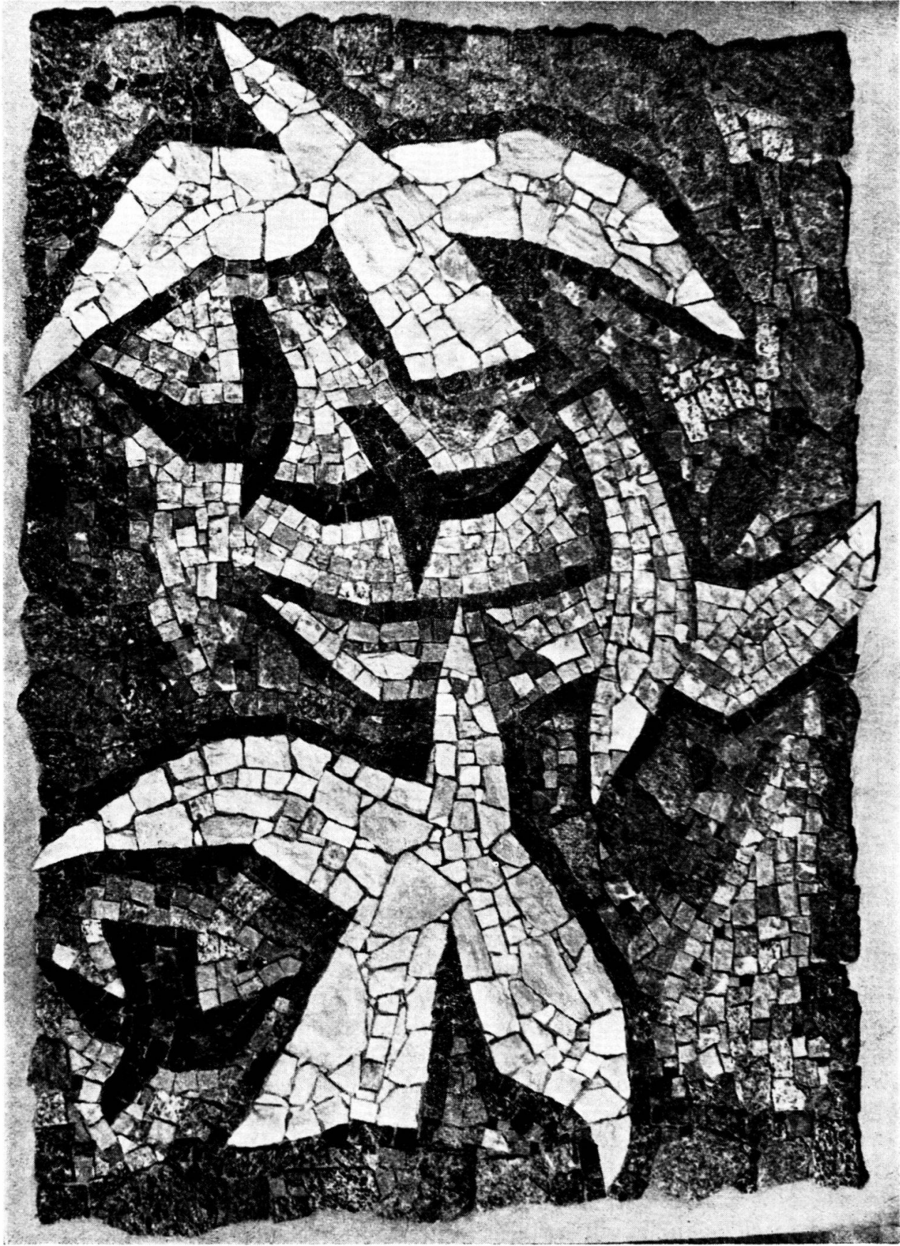
Fernando Lardelli - Volo d'uccelli - Mosaico