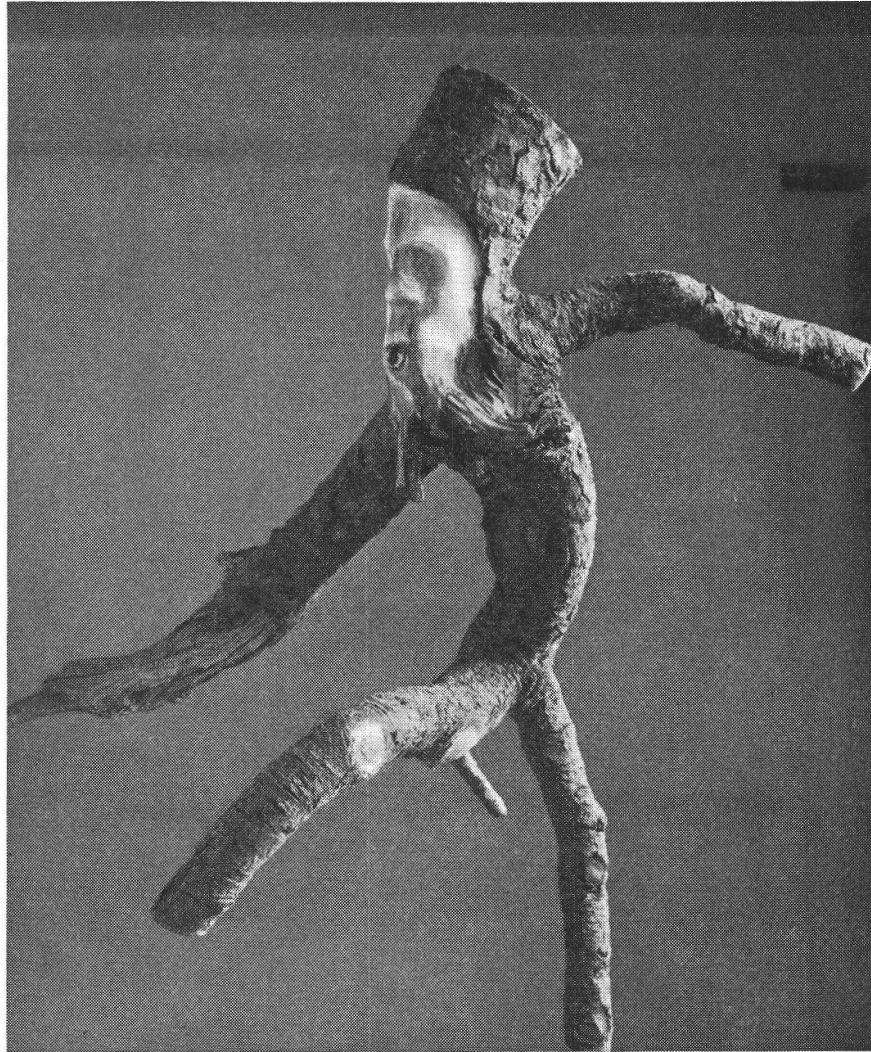
Not Bott: fauno

Tutti erano tubercolotici, le mani traspiravano, i loro volti erano quelli di fantasmi. Padre Beraldo entrato silenziosamente diceva: «ora a nanna, figlioli. Vi abbiamo già parlato oggi, domani dobbiamo fare un'altra visita». Se ne andavano intristiti, rimanevamo soli. Da fuori sembrava che giungesse intenso il respiro di tutti i tubercolotici che colà vivevano e anche morivano.