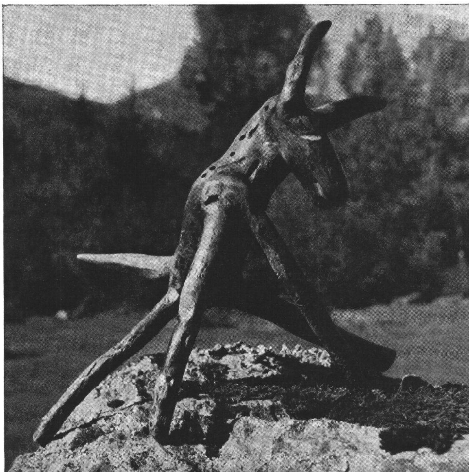
Not Bott : asinello

Avevo pure conosciuto alcuni bimbi, ospiti di quelle valli e pure loro ammalati. Però non lo sapevano. Ridevano quando entravo nella vasta stanza dei giocattoli, con i cavalli a dondolo, gli orsi sulle rotelle, gli agnelli di velluto bianco che i malatini stringevano come fossero le loro mamme.