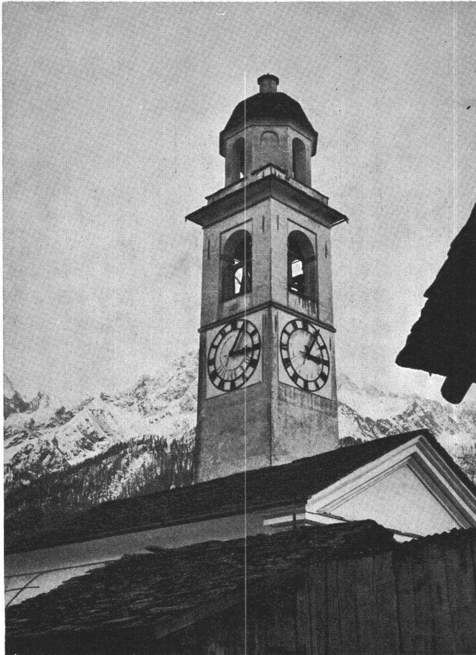
Il campanile, restaurato, della vecchia chiesetta che ha per sfondo la Bondasca innevata.