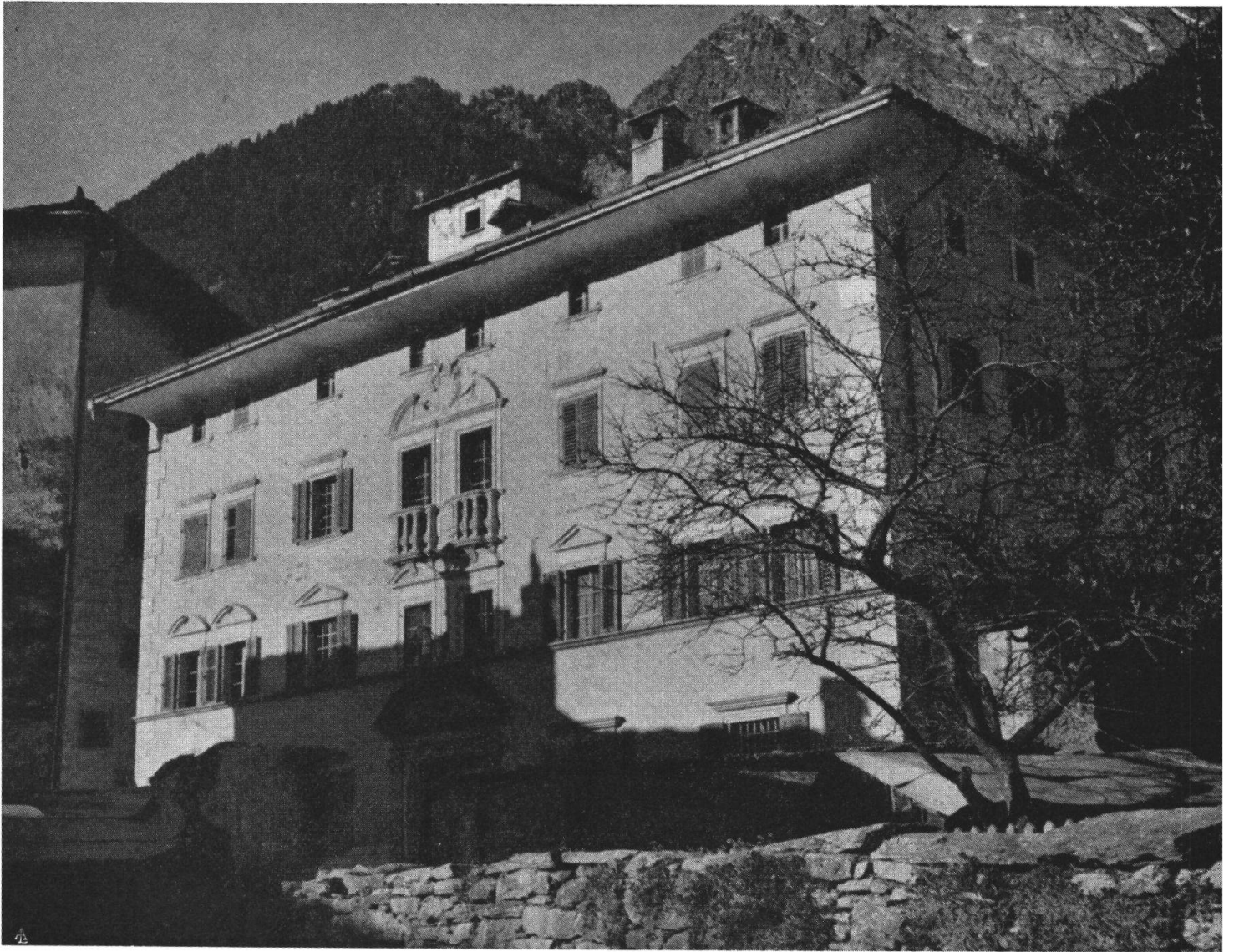
Il palazzo Von Salis, detto «Casa Battista», ora occupato dall'Albergo Willy.

Il turista che, appena varcato il confine elvetico a Castasegna, corre a perdifiato verso il Maloggia e le balsamiche aure dell'Engadina, non sospetta, percorrendo la Bregaglia, della esistenza di Soglio, non avverte il modesto cartello che ne pronuncia il nome poco prima di Promontogno, dove si stacca la strada che con ardite svolte, tra castagneti e cascine, porta lassù, vincendo un dislivello di circa trecento metri. Eppure vale ampiamente la pena di abbandonare la strada di valle e di salire fino a quell'aereo villaggio adagiato su un balcone solatio, a millecento metri sul mare: Soglio, soglia del paradiso.