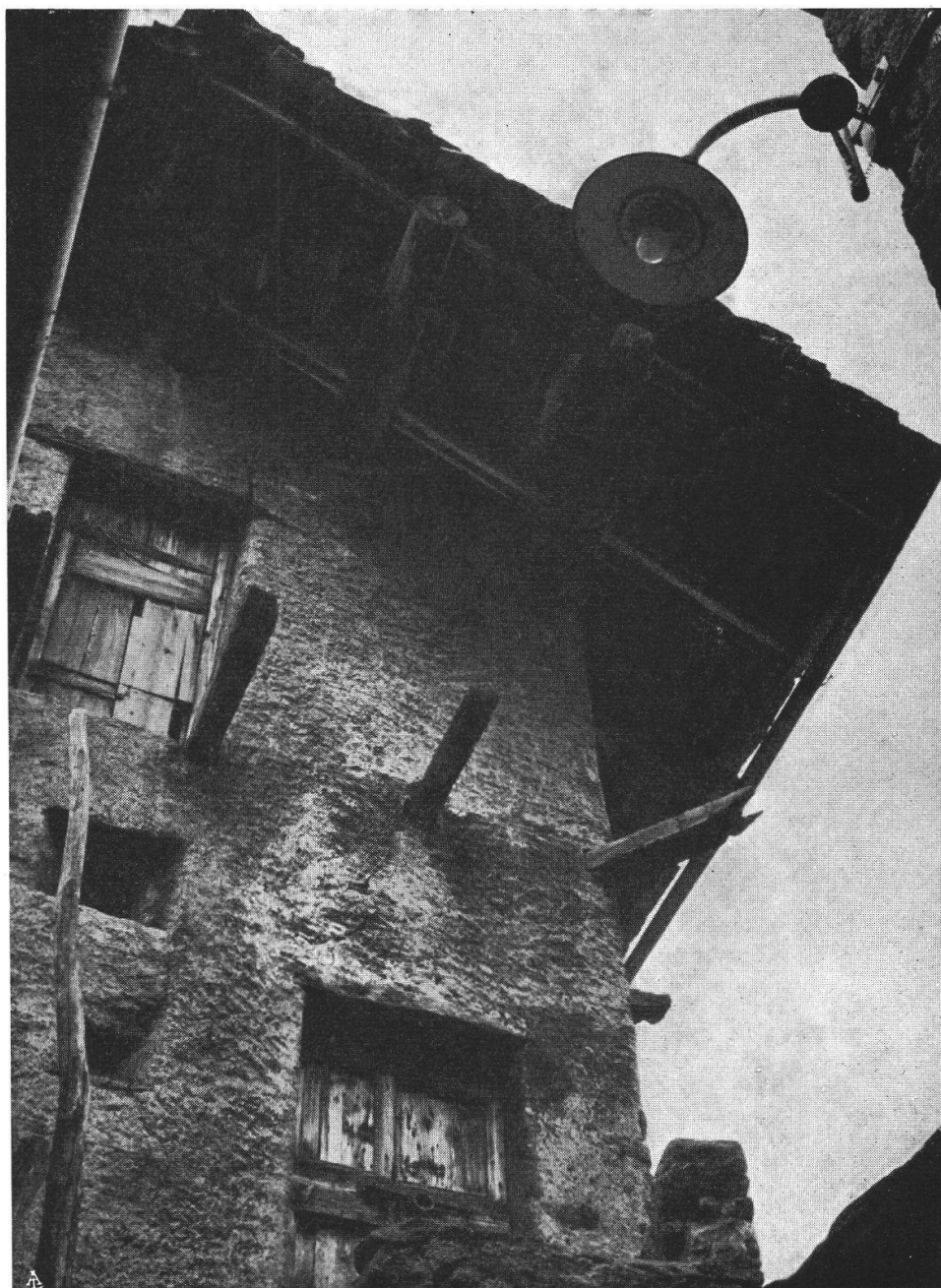
Una casa di Soglio come era circa quattro secoli or sono, unico elemento che l'ambienta nella nostra epoca, è la lampada elettrica in alto a destra.

Le tre case maggiori sono denominate secondo il nome del costruttore o di un proprietario: « Casa Max », « Casa Battista », « Casa Antonio »: e stanno allineate e unite a nord del villaggio. Sono grandiose costruzioni, nelle quali la vastità stessa assume carattere artistico, il solenne quadro