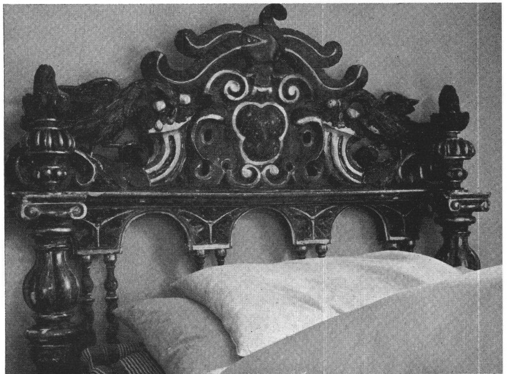
L'elaboratissima testiera di uno degli antichi letti di casa von Salis

La Casa Max fu costruita nel 1695 dall'ambasciatore Rodolfo von Salis (il nome attuale risale all'ultimo proprietario, Max von Salis, morto nel