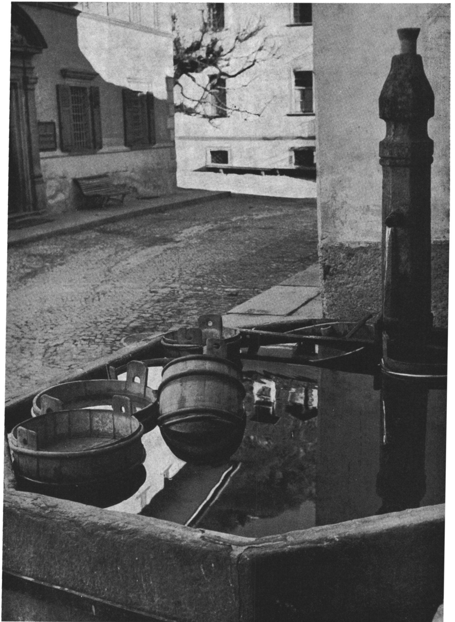
La fontana pubblica davanti alle case von Salis, con i secchi di legno di fabbricazione locale, che rammentano la pastorizia