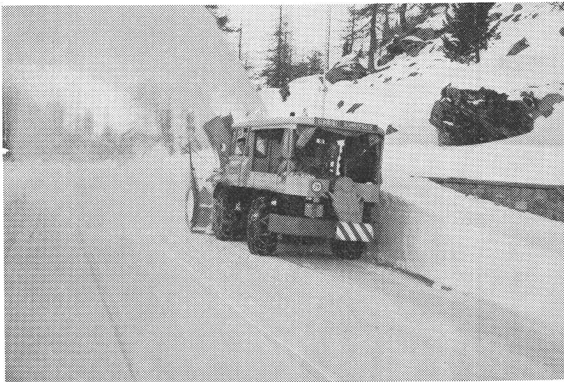
La fresatrice del Bernina affronta ed allontana senza difficoltà strati di neve della sua stessa altezza. Si noti la larghezza della pista stradale dove essa è rifatta a nuovo.

dalla prima caduta di neve sino a che dura il transito colle slitte ed anche più tardi se eccezionalmente causa caduta di neve si rendesse necessario.