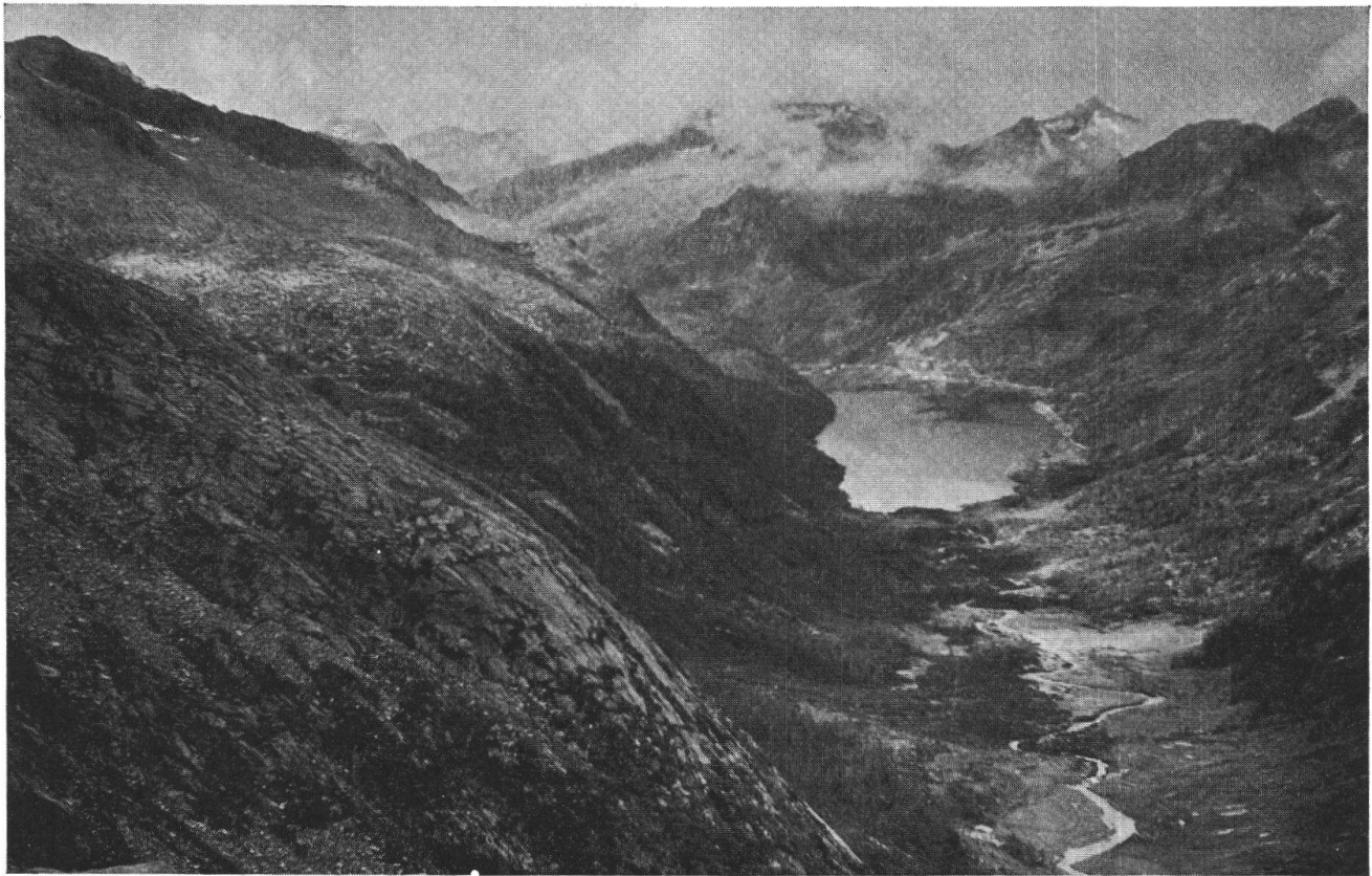
Val di Fumo. Il Coster di Sinistra. Esso appartiene al sistema erosivo « Pian del Meden » e costituisce il testimoniao piú evidente di un vecchio fondo di valle del periodo pliocenico. Sul fondovalle il bacino artificiale della Val di Fumo.