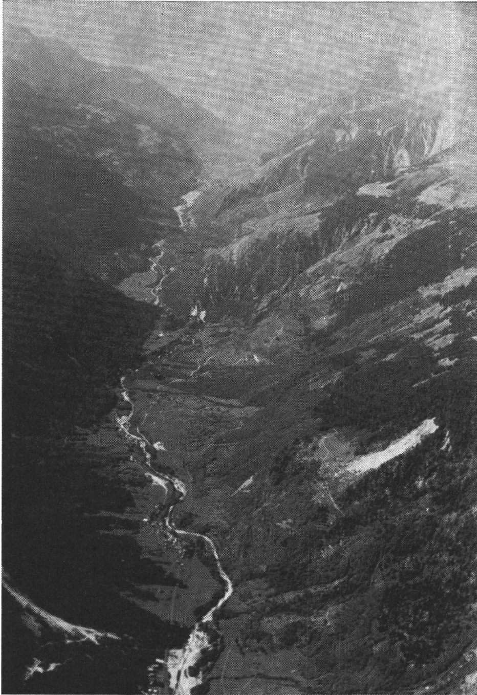
La Valle Bregaglia vista da sud. Sul versante destro notiamo due sistemi di terrazzi posti a due quote diverse e occupati in parte da alpi e maggesi. I terrazzi dei ripiani superiori appartengono al sistema erosivo di Aura Freida, mentre quelli inferiori appartengono al sistema erosivo di Selva.