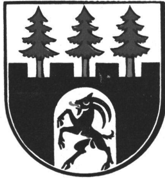
Stemma di Bondo