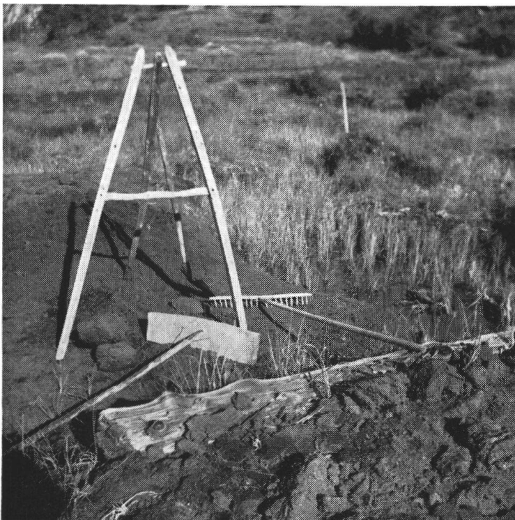
Treppiede, badile e rastrelli a foggia diversa: arnesi indispensabili per la lavorazione della torba.

grossi tronchi di cembri, larici e abeti antichi. Immersi nell'acqua e nel fango, completamente isolati dall'aria, essi si sono conservati sani.