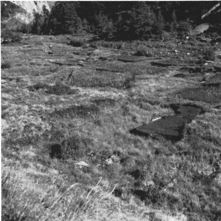
Torbiera alla Palü Märcia. Si discerne ancora il terreno suddiviso in spiazzi.

Le torbiere della Palü Märcia si presentano assai profonde. Gli strati di torba raggiungono in certi posti i 3 m di spessore e contengono anche