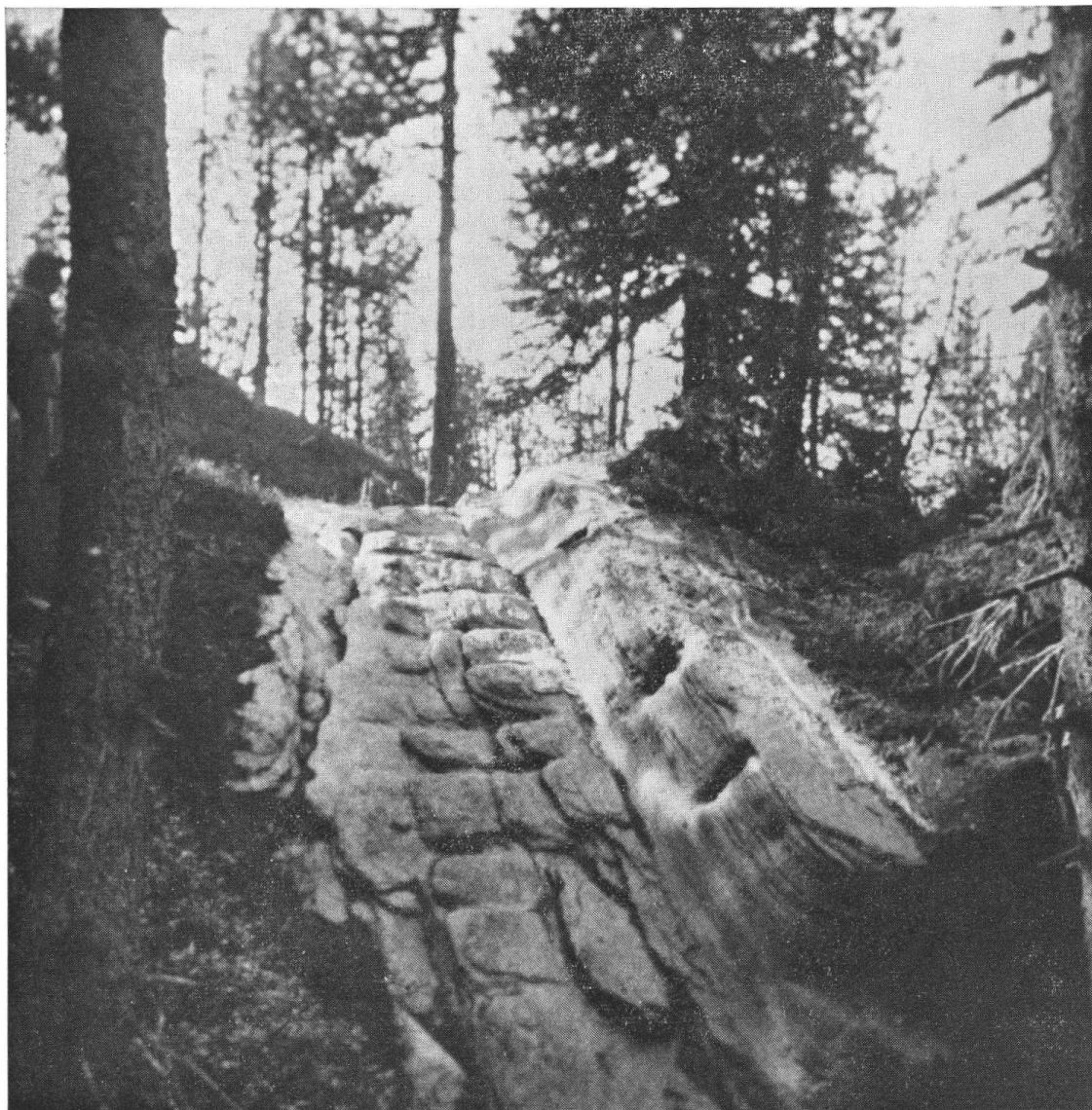
Strada romana al Malögin