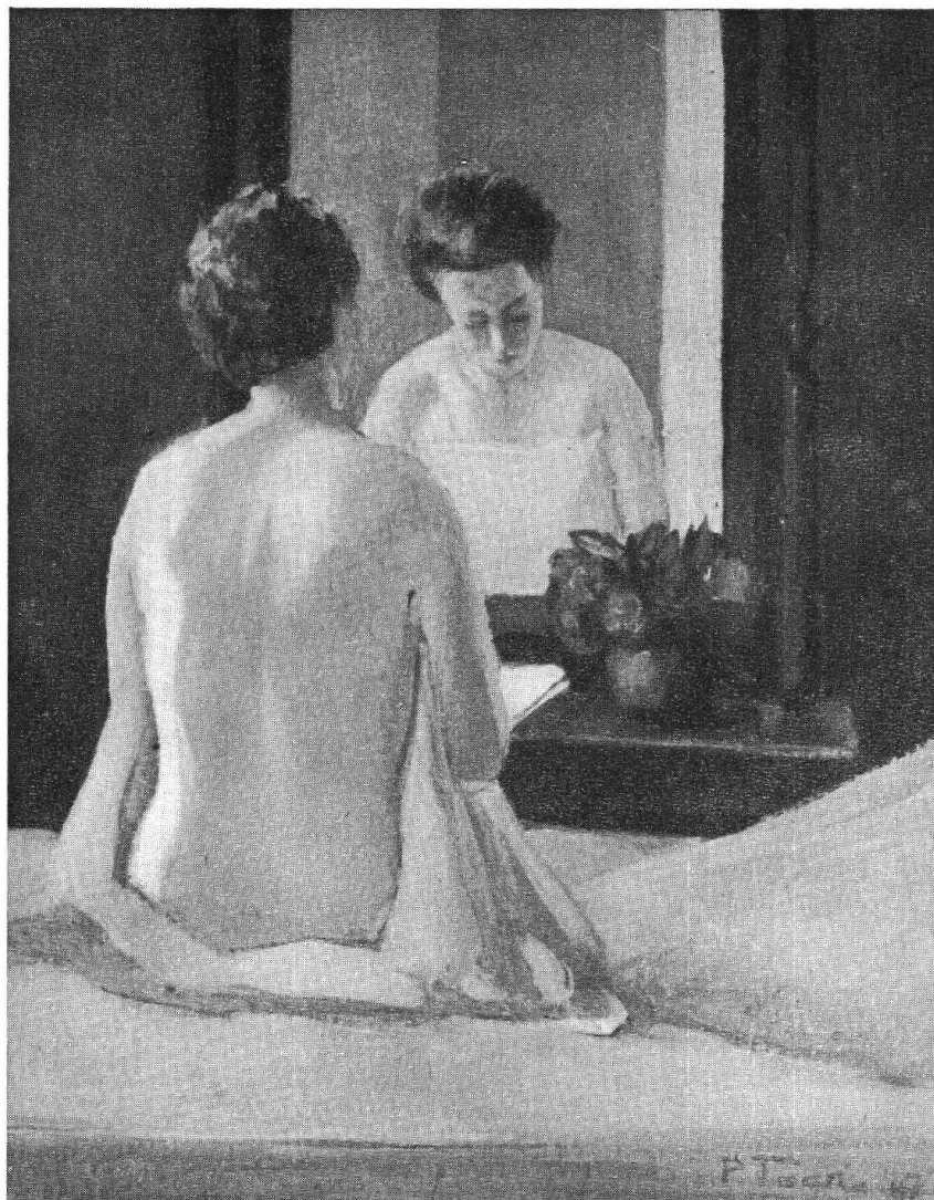
P. TOGNI : Donna allo specchio (tempera)

tazione, inondandola di fumo e odore, a disperazione della Signora Bianca, quando la preparava al fornello. Si capisce che la sua tecnica non gli permetteva una grande produzione.