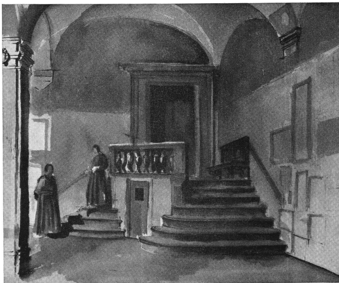
P. TOGNI : Chiostro di S.to Spirito a Firenze (china)

sibile e più significativo. Lavoro di pazienza, d'ordine e di esattezza. Questa è, secondo me, l'arte di Ponziano Togni che ci chiarisce e ricrea il fascino, continuamente in trasformazione e sempre rinnovantesi, dell'universo e della vita.