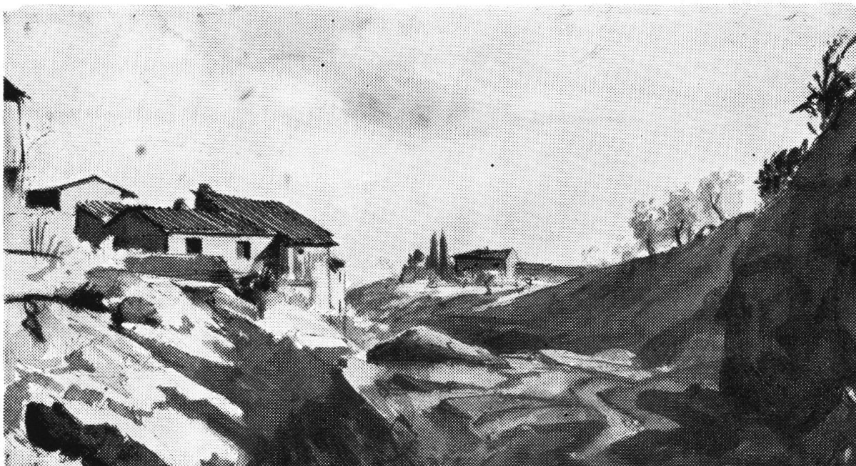
P. TOGNI : Case nel Mugnone (china)

« Proprio per questo sono diventato anche un acquarellista. »