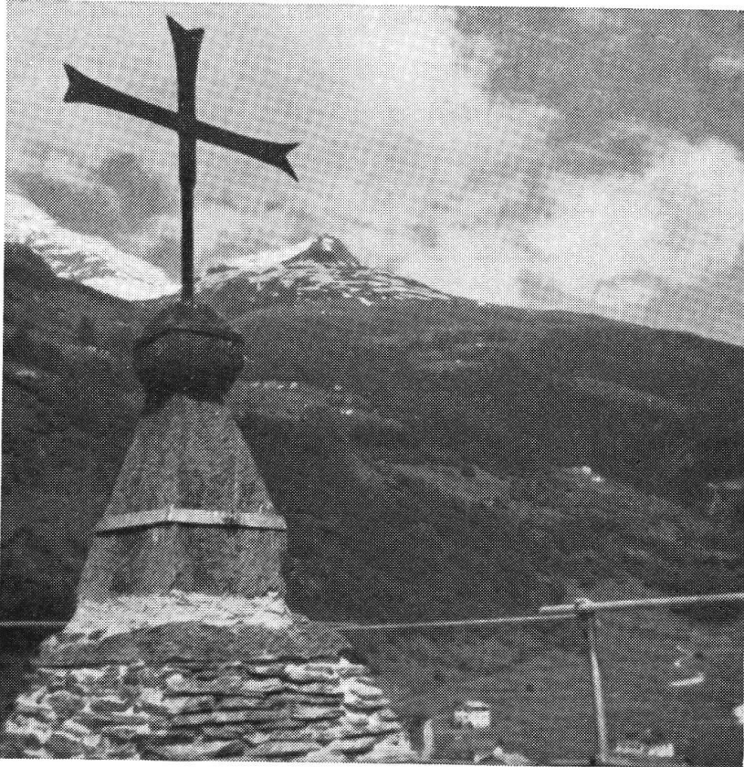
La croce della torre