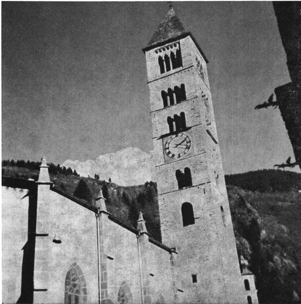
La torre campanaria