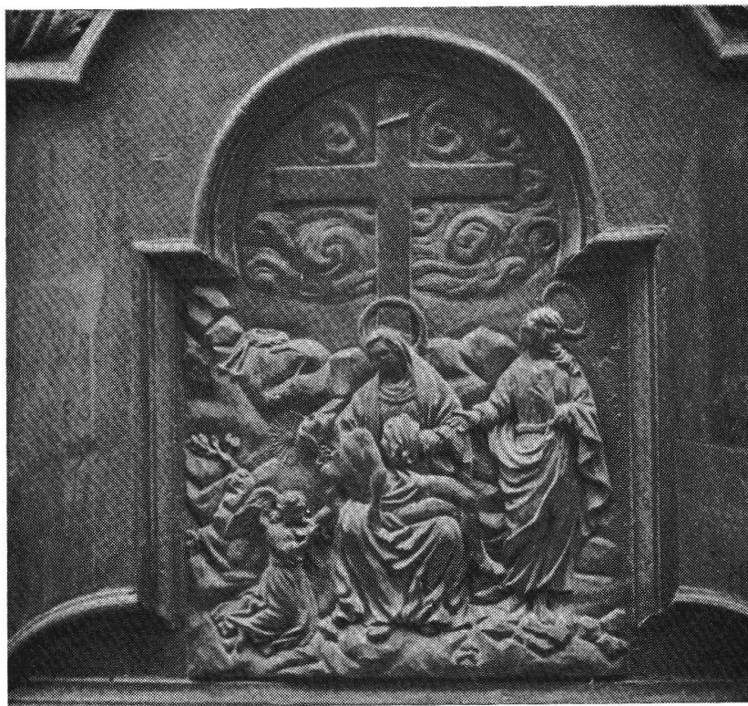
Particolare della porta

e che la giustizia era sacra nei secoli passati, tanto da essere affidata preferibilmente alla chiesa piuttosto che a qualunque istituzione civile.