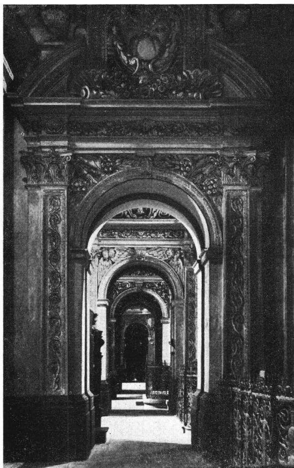
Enrico Zucalli, Monaco, Chiesa dei Teatini, decorazioni

La sua importanza nel contesto dell'arte barocca tedesca gli valse, già nel 1912, una monografia pubblicata a Strasburgo. 2)