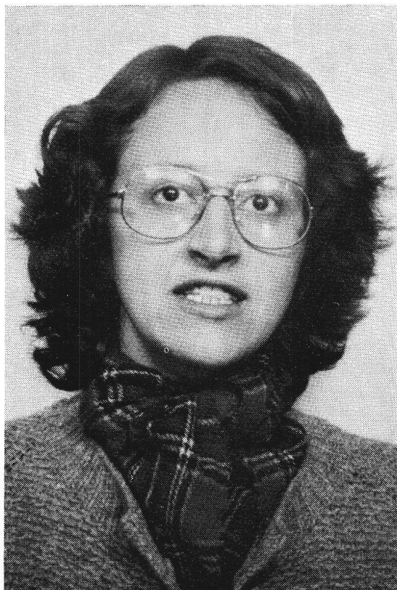
PROFESORESSA POSCHIAVINA A COIRA

Il governo cantonale ha eletto quale docente di italiano e di storia alla scuola magistrale cantonale Silva Semadeni , di Poschiavo. Succede al suo insegnante prof. R. Boldini. L'abbiamo conosciuta in cinque anni di magistrale, sappiamo che ha atteso con serietà e diligenza alla propria preparazione, quindi non dubitiamo affatto che non possa rappresentare degnamente il Grigioni Italiano fra il corpo docente del nostro « semenzaio » di maestri.