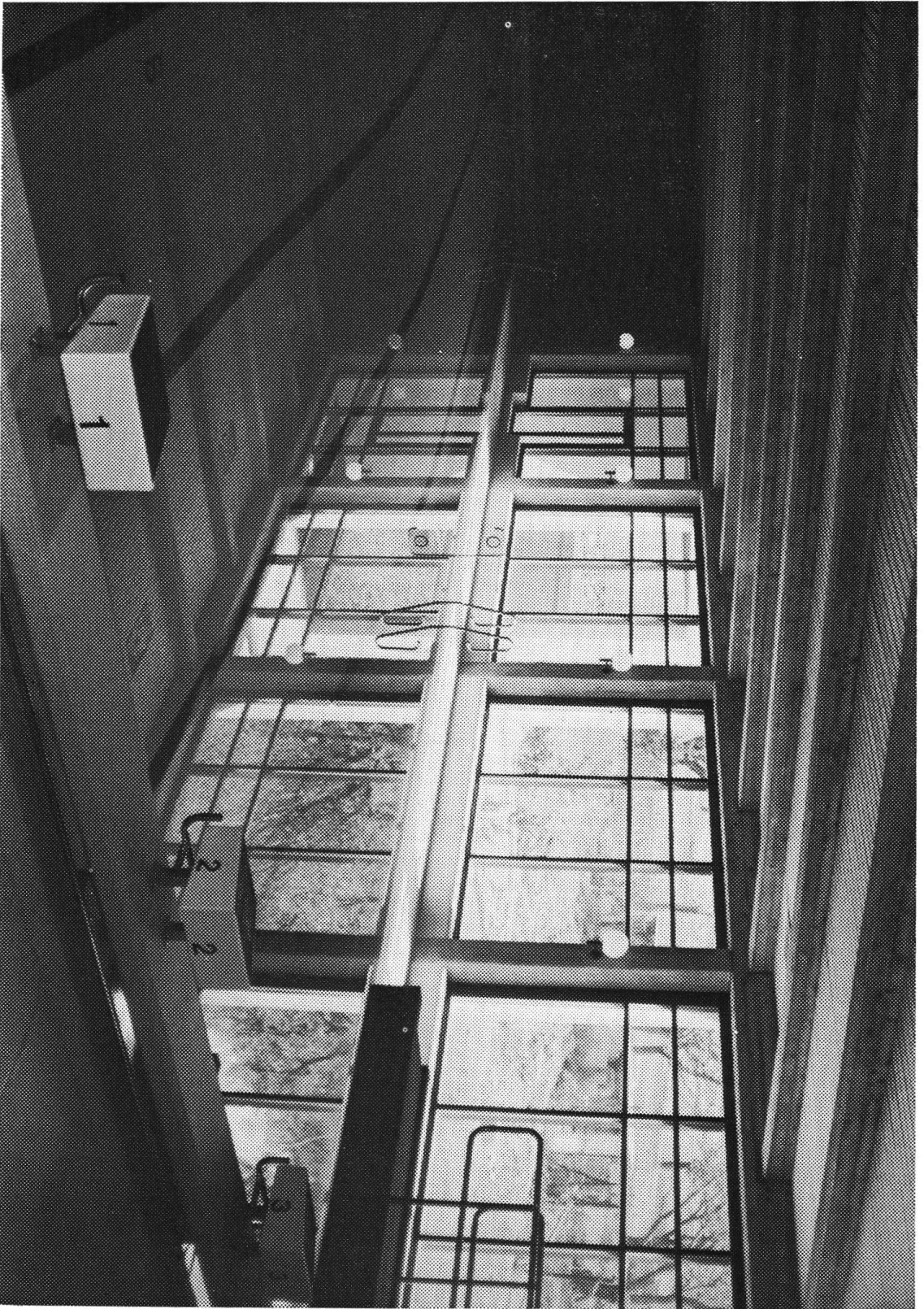
Interno della piscina coperta di Poschiavo