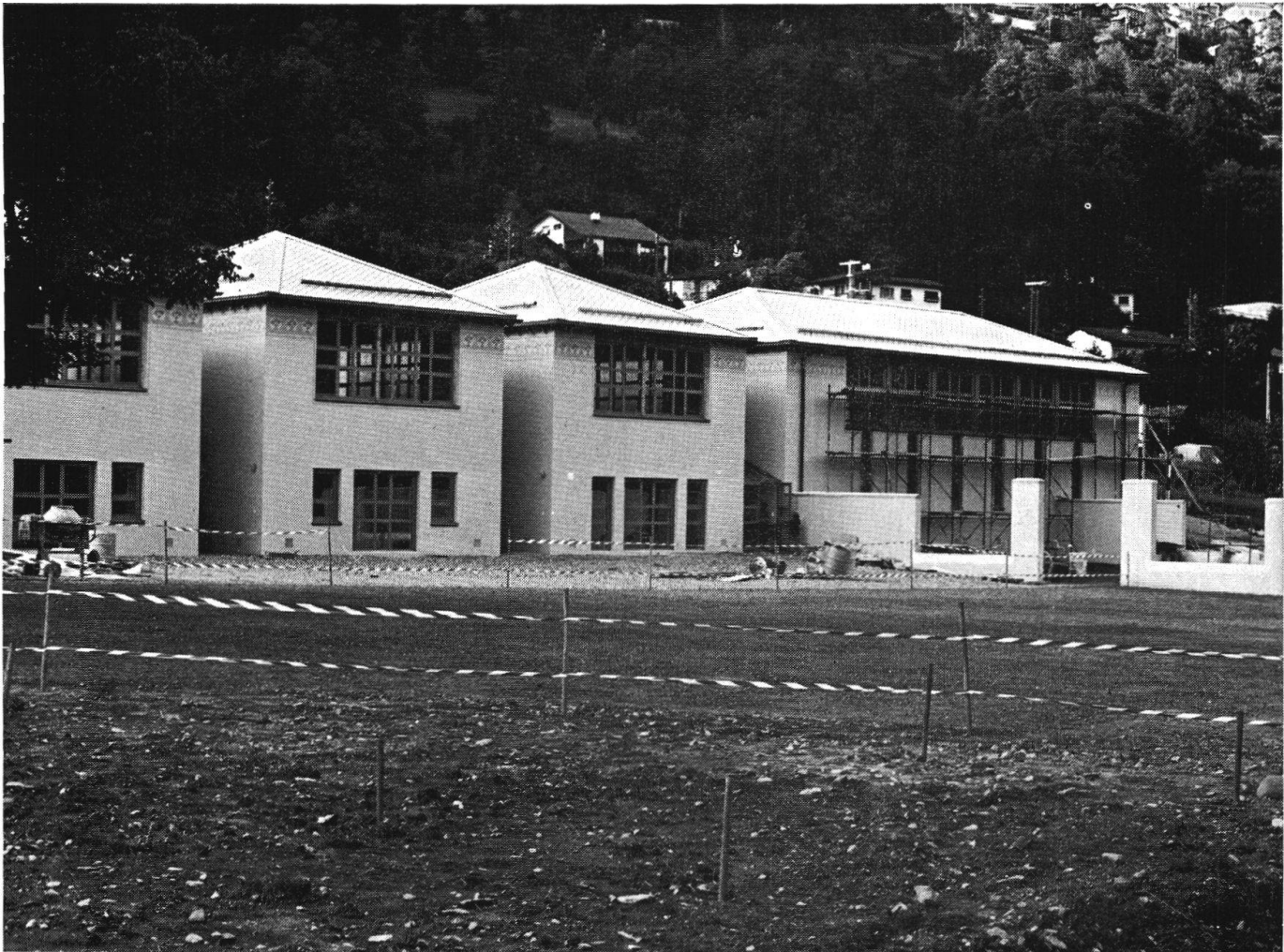
Centro scolastico di Castaneda