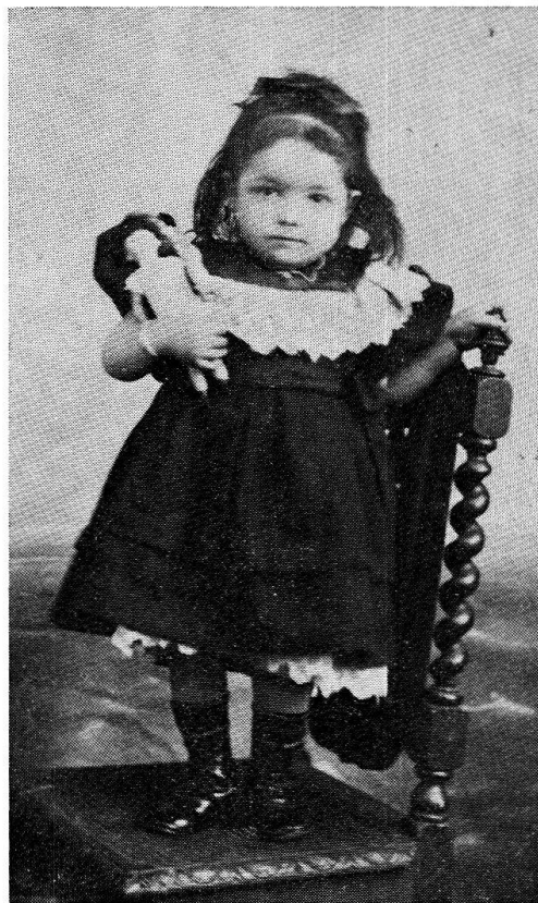
NN, Mesocco, 1910 ca.

E quando veniva il Bambin non c'era da fare tante storie: giocattoli e giocattolini, e una roba e l'altra. Mi ricordo sempre: me ne hanno fatto di scherzi: una volta mi hanno portato una cicca di tabacco, per scherzo; era il mio povero zio. Sulle finestre mettevamo un piatto con il sale perchè veniva l'asino a leccare. Poi di