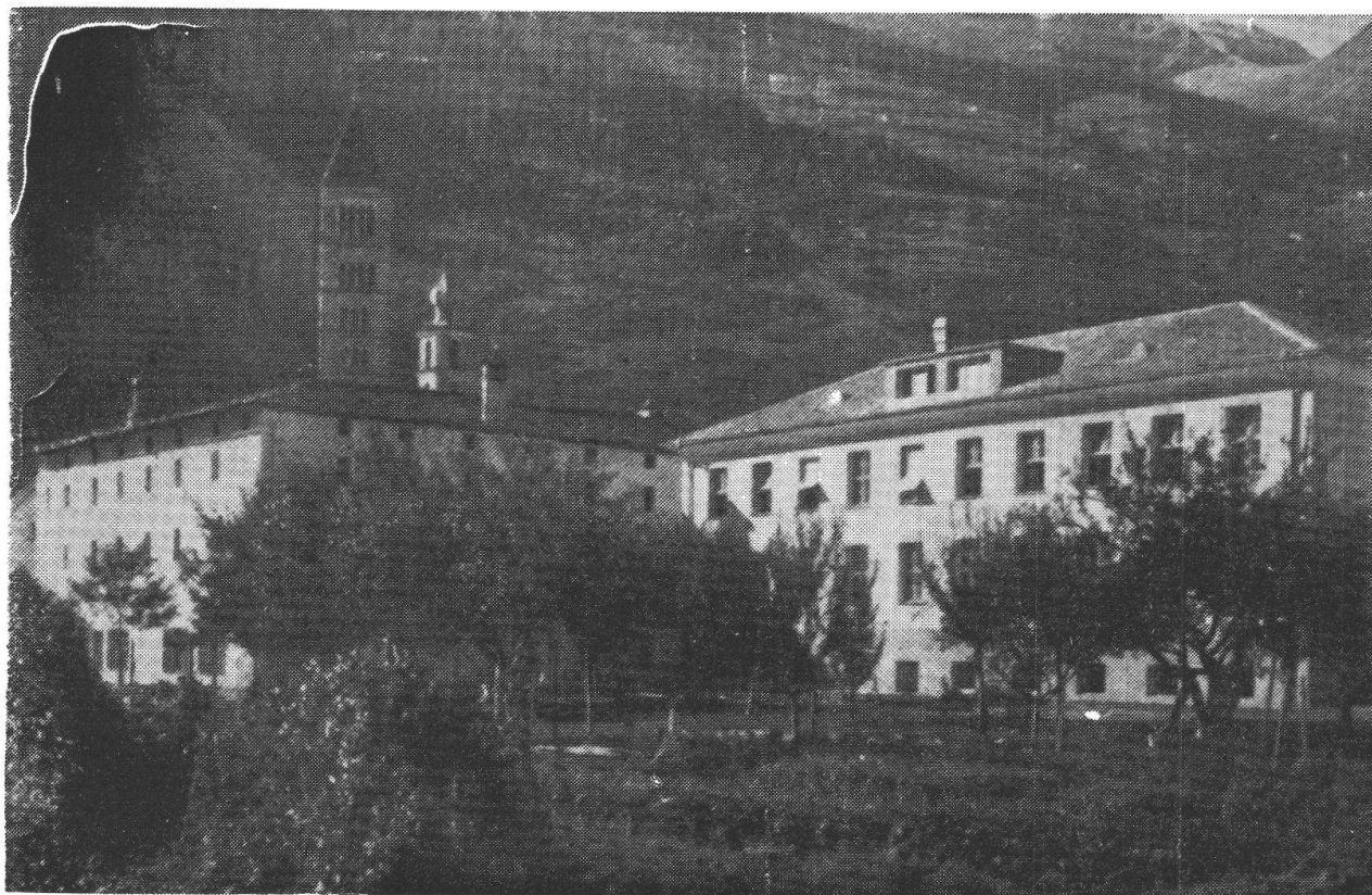
Il vecchio Monastero. A destra le scuole, dove ora sorge la casa per anziani