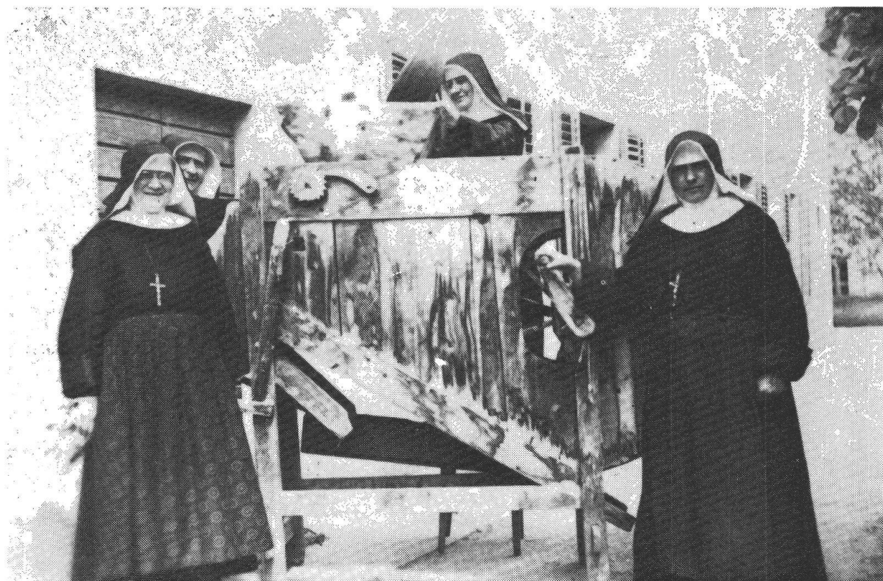
Suore vicino alla macchina per la pulitura del grano (mulinello), costruita nel 1810, bruciata e sostituita nel 1939.