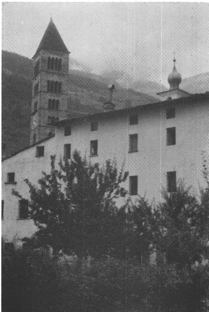
Facciata sud-est del Monastero