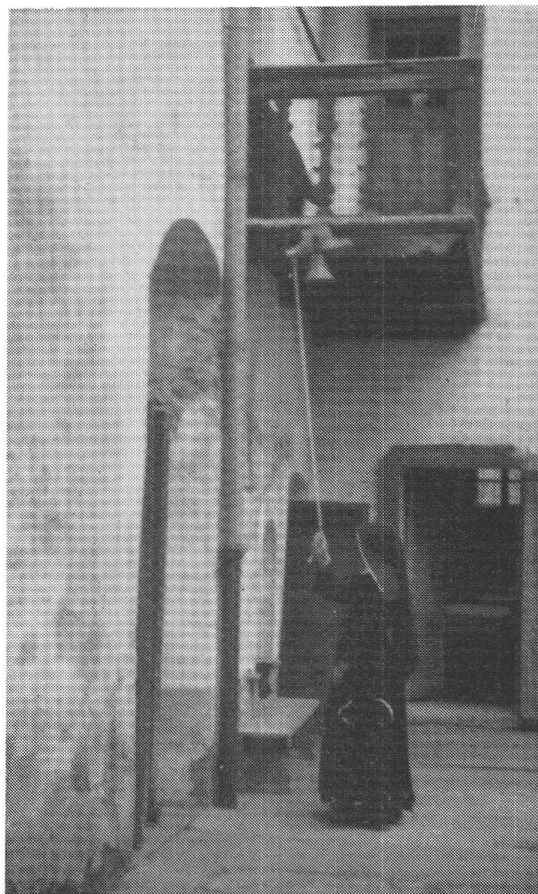
Suora che suona la campanella davanti alla porta del coro e del refettorio