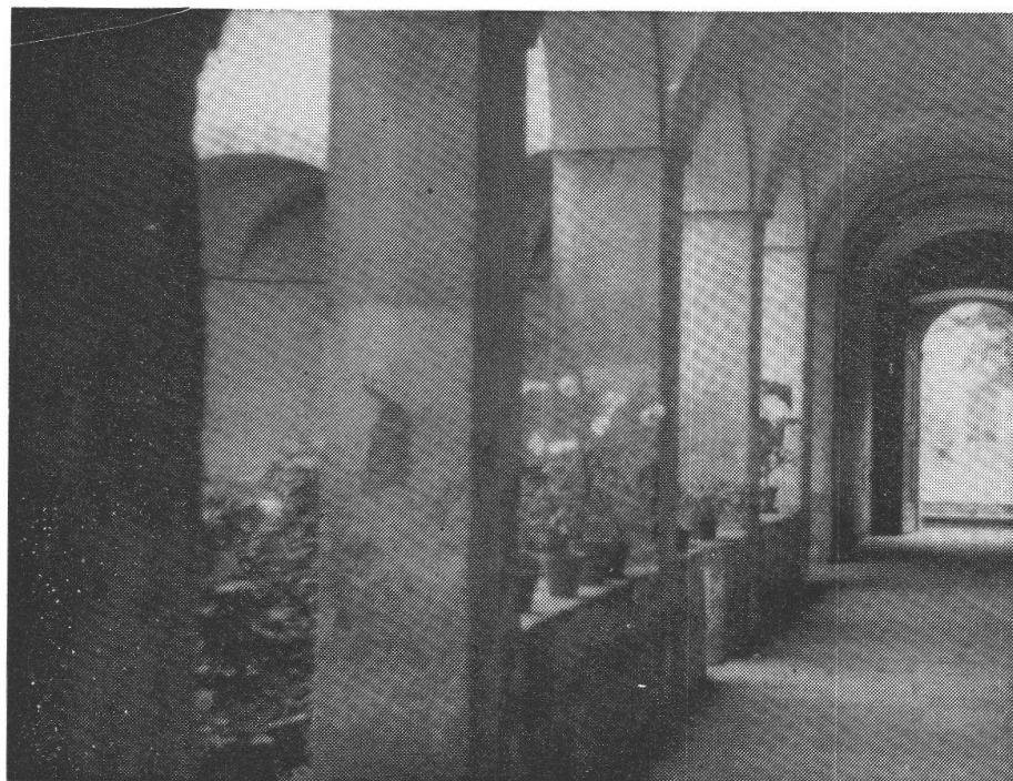
Corridoio del chiostro con porta che dà sul giardino