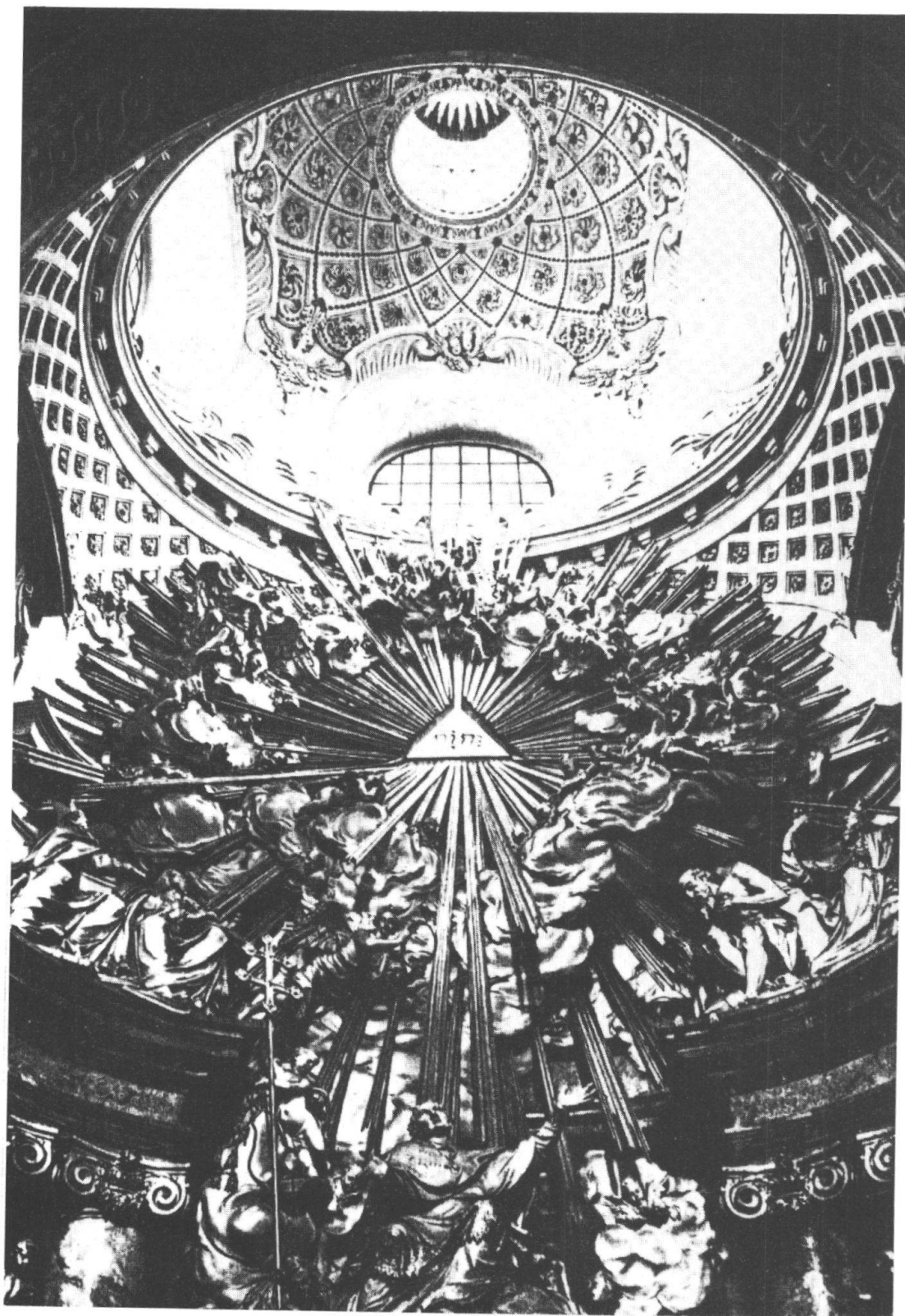
Nella chiesa di San Carlo, l'originale cupola sopra l'altare maggiore con i suoi ornamenti di stucco, opera di Alberto Camessina che si è ispirato a F. Borromini