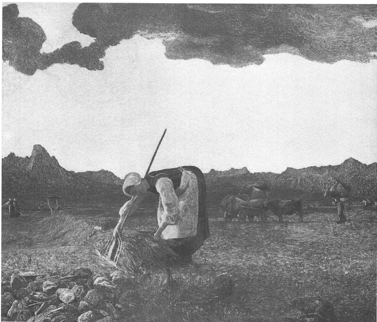
La raccolta del fieno

me l'armonia della natura nei rapporti, anche simbolici, legati alle stagioni dell'anno ed alle diverse ore del giorno.