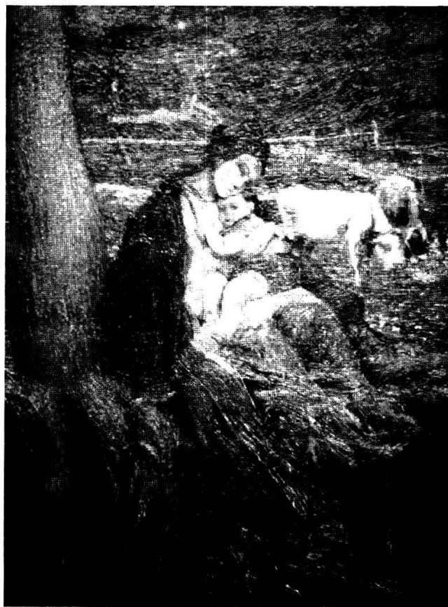
La Vita, particolare