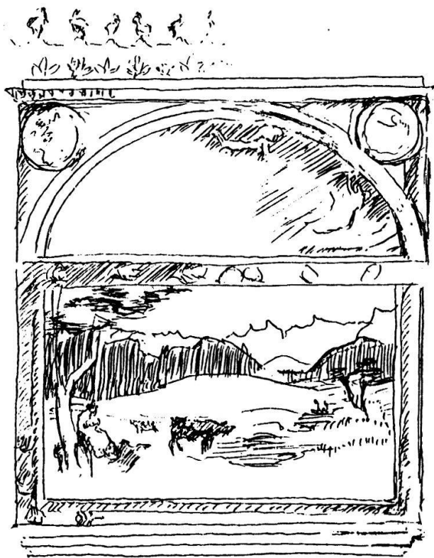
La Vita, schizzo dal cartone d'insieme

E si potrebbe cercare di chiarire se, al di là di certe sue adesioni anarchiche al socialismo dell'ottocento, l'arte di Giovanni Segantini s'inserisca nel mondo dell'utopia. Ma questo richiederebbe uno studio più vasto ed approfondito di quanto questa umile dissertazione possa pretendere.