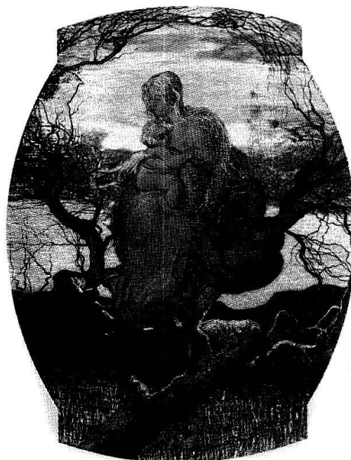
L'Angelo della Vita

La natura, quale terra, campagna, paesaggio, appare come dispensatrice di fertilità e di vita. Segantini s'avvicina così a certe correnti di pensiero utopico dell'epoca. Sono per esempio celebri i gruppi antroposofici e vegetariani che fondarono, nei primi decenni del secolo, la colonia di Monte Verità presso Ascona. Per gli artisti, anche Segantini propone una vita in «conviti»: «L'eletto che si sentirà tormentato dalla passione dolce e buona dell'arte, dovrà abbandonare parenti e ricchezze, e così spoglio di ogni materiale possesso presentarsi a quel convito d'artisti che crederà risponda al suo senso ideale. Di questi conviti se ne troveranno sparsi in tutte le regioni, ed in essi si troveranno uniti arti-