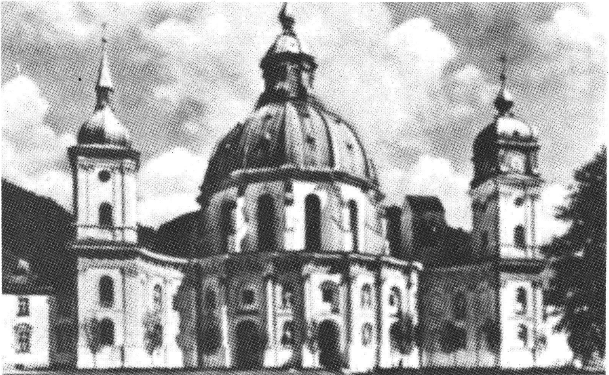
E. Zuccalli: chiesa conventuale di Ettal, 1711 (A. Reinle, Unsere Kunstdenkmäler XXIV, 1973, n. 4. p. 233)