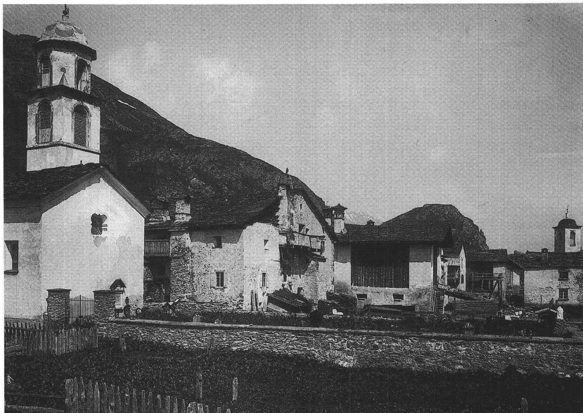
Bivio