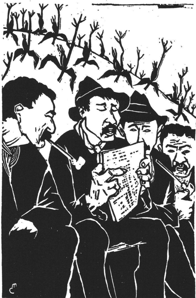
Illustrazione di Clément Moreau per il romanzo Fontamara di Ignazio Silone

L'incontro con la Svizzera è determinante per la formazione socio-politica dello scrittore. Costretto a rinunciare al suo engagement politico si mette subito a scrivere. Il primo libro, Fontamara (pubblicato nel 1933) contribuirà a propagare in Europa quelle idee di giustizia e libertà che nella mente di Silone si associavano ad una fondamentale insofferenza nei confronti dei regimi totalitari. Nel 1936 esce il secondo romanzo, Vino e pane e nel '38 La scuola dei dittatori .