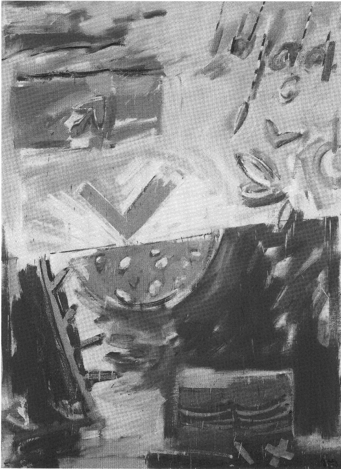
«Senza titolo» 93/2 olio su tela, 190 x 135 cm, 1993 proprietà Hoffmann-La Roche, Basilea