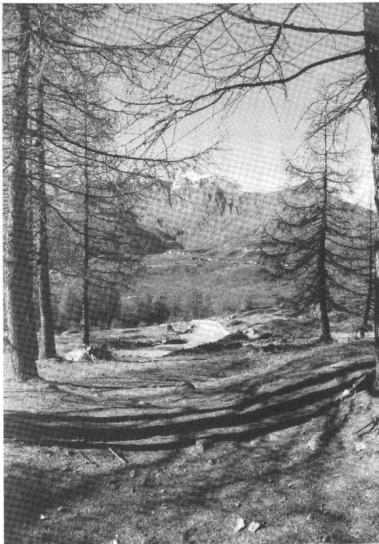
«Vestigia di vecchi passaggi, tra i tratturi ancora esistenti...». («Strada romana o di sopra» sopra gli Andossi verso Montespluga).

E' anche possibile e forse probabile, che Plinio abbia scoperto la vallata scendendo dal Nord a Sud, tornando o venendo dal valico. Anche in questo caso egli avrebbe