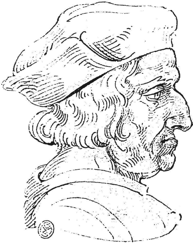
Ritratto a penna del Maresciallo Gian Giacomo Trivulzio, conservato nell'Archivio e Biblioteca trivulziana del Castello sforzesco di Milano