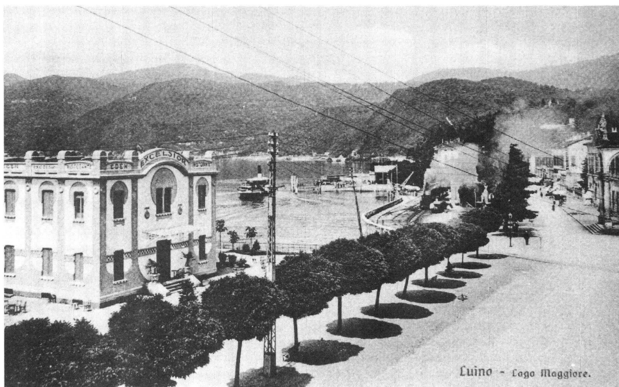
Una delle bische notturne de «Il piatto piange»

Chi vuol avvicinarsi troppo a interessi giganteschi, rischia di perdere tutto, a meno che non sia prevenuto e appartenente al gruppo degli iniziati. Dopo aver capito che dietro ai quattro o cinque si cela una potente organizzazione come quella della massoneria, dove solo gli adepti possono governare e attingere al calice della saggezza, dove il 'tempio' è fatto di uomini e non di pietre, la piramide del potere a Luino appare in un primo tempo indistruttibile e resistente agli attacchi dell'ideologia fascista, finché non si estinguerà definitivamente la vecchia guardia dell'aristocrazia luinese e la guerra seppellirà quell' ancien regime sotto le macerie.