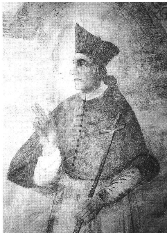
Due degli affreschi che stanno ritornando alla luce grazie al restauro della Cappella

compatta di intensa espressività», «capolavoro del Barocco che meriterebbe più considerazione», «una Pietà commovente, toccante», «opera d'arte di non comune valore», «mai vista una tale posizione del corpo di Cristo», «stupenda Pietà, indubbiamente influenzata dalla Scuola spagnola» ecc.