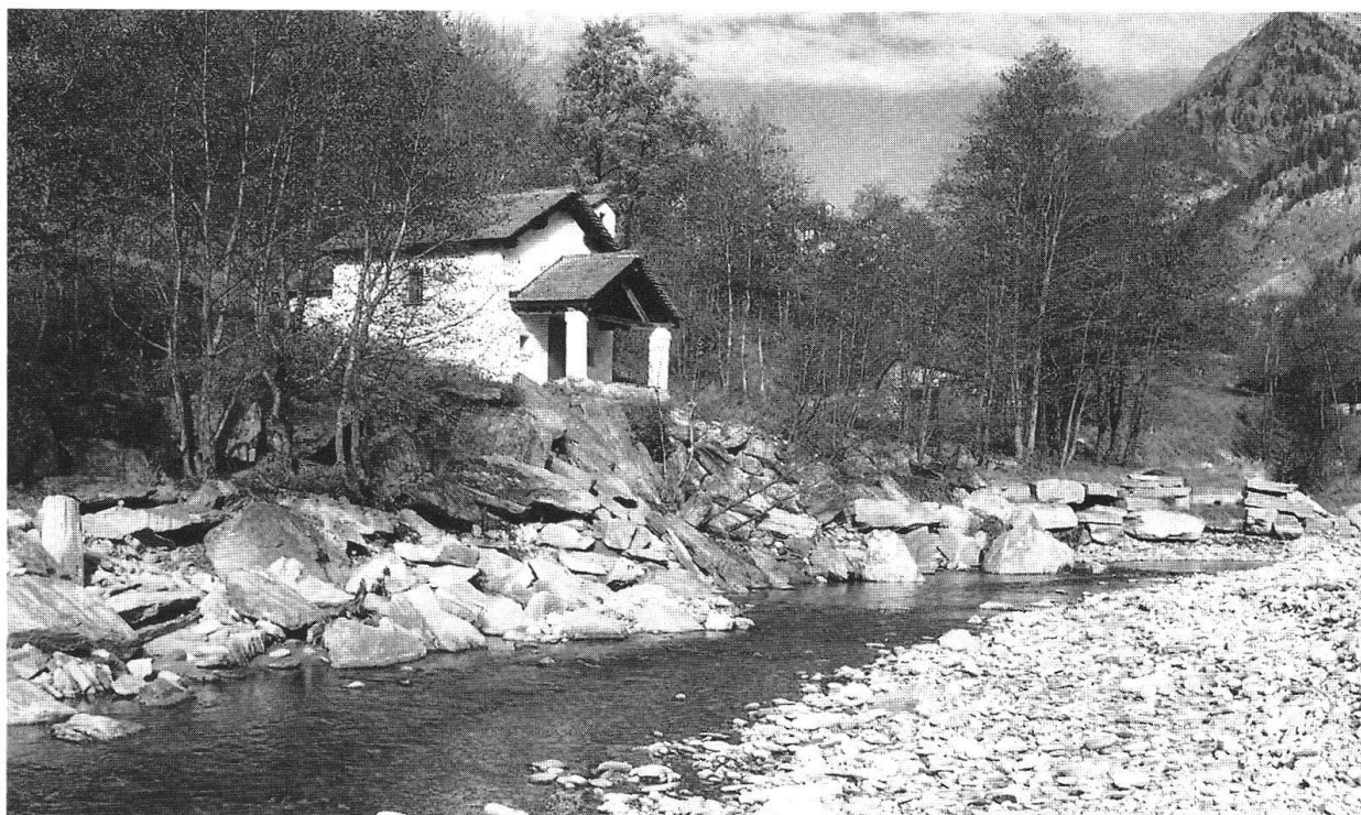
Cappella della Madonna Addolorata di Salàn

Dopo esserci soffermati, nel primo numero del 1998, sul restauro dell'Hotel Albrici di Poschiavo, questa volta ci spostiamo in Val Calanca e andiamo ad ammirare un affascinante luogo di culto: la cappella di Salàn.