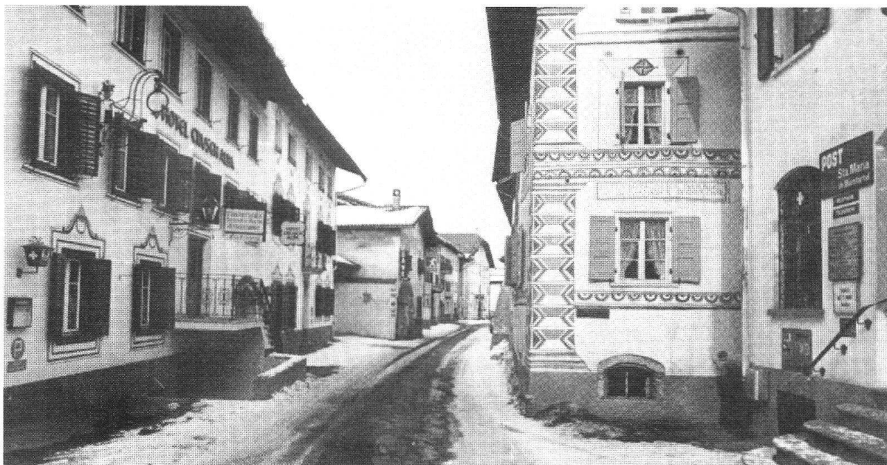
Santa Maria, nella Val Monastero, poco lontano dalla Calven, dove nel 1499 si combattè la storica battaglia

nava carponi incitando i suoi uomini e gridando: «Su, su, camerati, non badate a me, io non sono che un uomo solo. Su, o restate Grigioni oggi o non lo sarete ma più!».