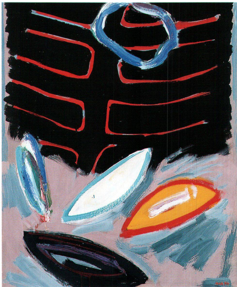
Paolo Pola, Vergehen , 1994, collezione privata

solitario, come disperso nella distesa bianca. Si staglia nel cielo vitreo e terso un'enorme nuvola, grigia ai lati e luminosa all'interno, potente metafora del duplice significato della morte che è fine e inizio di tutto, ultima tappa del percorso terreno e prima tappa della vita celeste. In tal modo l'eterno sembra aprirsi e preannunciarsi attraverso il nucleo centrale della nuvola, come un'apertura provvidenziale nel cielo rigido.