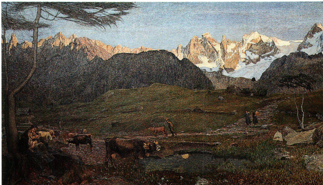
Il trittico della natura, parte sinistra: La vita, [1896-99], Museo Segantini, San Moritz

tenendo in tal modo un'incredibile energia, come se si rappresentasse uno scontro tra meteoriti. La spirale, posta all'angolo inferiore della parte destra della tela, sembra infatti fungere da punto d'attrazione magnetico al quale gli altri elementi sono costretti a confluire. Così del resto si è formata la terra: da un nucleo originario che in un movimento di rotazione ha attratto a sé altri corpi celesti fino a diventare un globo sul quale in seguito ha preso forma la vita.