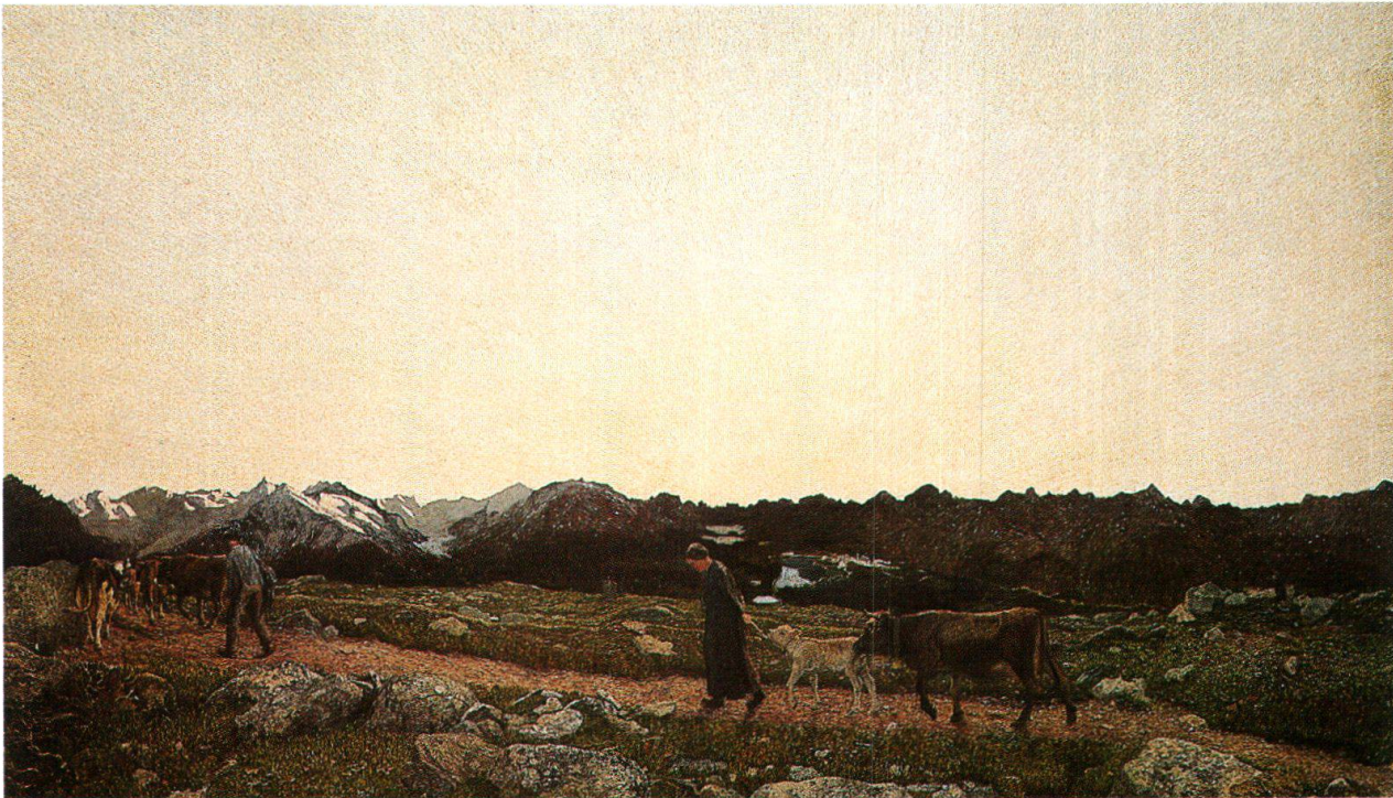
Il trittico della natura, parte centrale: La natura, [1898-99], Museo Segantini, San Moritz